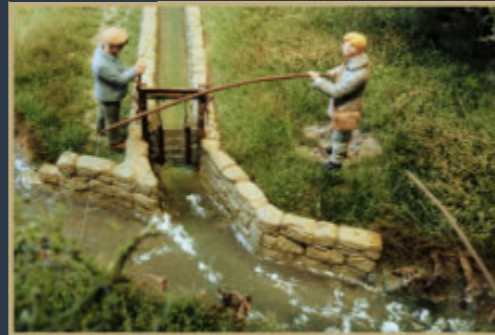
Bereits fertig und lieferbar! Mühlwehr und gemauerter Mühlkanal