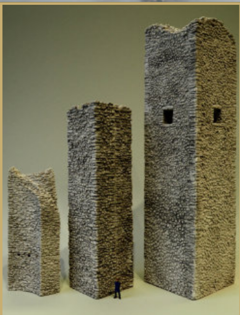
Die erste Bauteile zur Burgruine Tschanüff: der Bering (von 1254), die äußere Schildmauer (13. Jhdt.) mit Verstärkung (15. Jhdt.) und der Bergfried (von 1254)