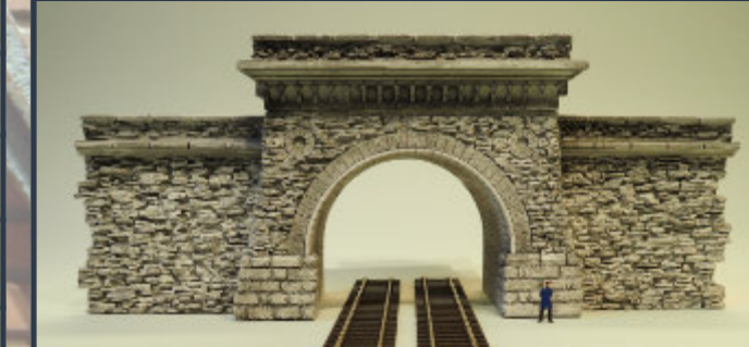
Das neue zweigleisige Steinfrei-Tunnelportal in Ho - die Flügelwände sind aus den neuen Steinfrei-Bruchsteinmauerplatte mit seitlicher Verzahnung.