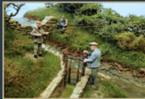
Das neue Mühlwehr in unserem Fotodiorama (Spur 0)