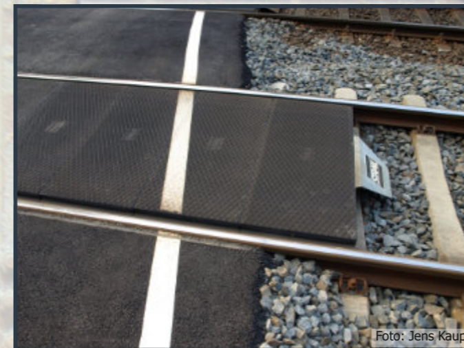
Die Hartgummigleisfüllungen, samt Kupplungsabweiserblech kommen nun in hochdetaillierter Ausführung auch für Spur 0