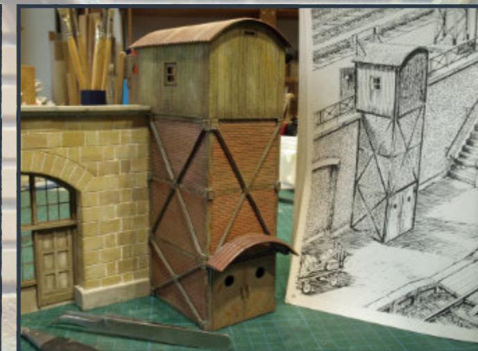
Der Lastenaufzug, passend zu den Steinfrei-Quadermauern nach Motiven des Modellbahnzeichners Pit Peg †.