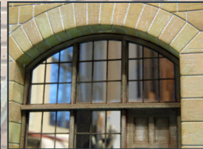
Details der Verglasung des Dienstraumes auch nach Pit Peg