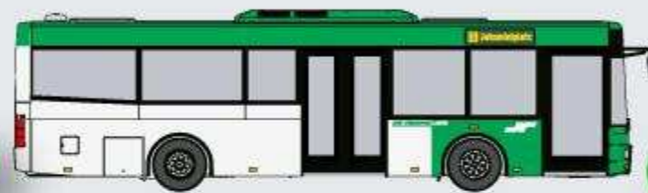
MAN NM 223.2 - Watzke Graz 08700917-3, 30 Jakominiplatz