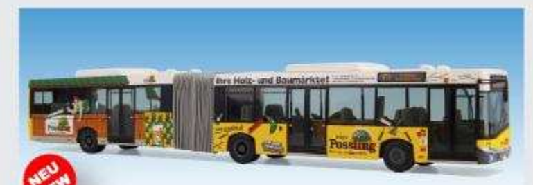
Solaris U18 - BVG 4196 Holz Possling 08701161-1, M76 U Walther-Schreiber Pl. 08701161-2, 171 Flugh. Schönefeld