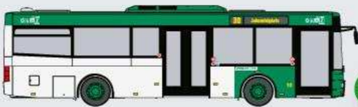
MAN NM 223.2 - GVB Graz 08700917-1, 30 Jakominiplatz, Wg.10 08700917-2, 30 Geidorf, Wg. 9