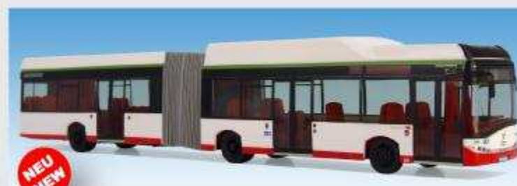
Solaris U18 Voith Hybrid - Vestische Herten 08701158-3, V Betriebsfahrt, Wg. 2301 (Überführungsversion, kleine Auflage)