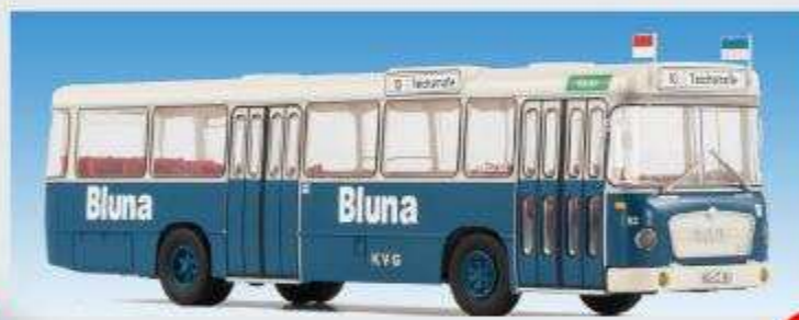
MAN Metrobus 750 HO - KVG Kassel 08701405-1, 20 Harleshs., Wg. 82 08701405-2, 10 Teichstr., Wg. 83 mit Bluna