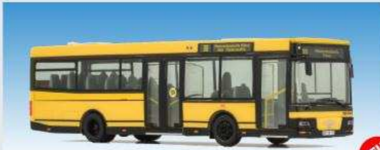
MAN NM 223.2 - DVS Dresden 08700908-1, 95 Röhrsdorf 08700908-2, 88 Kleinzschachwitz