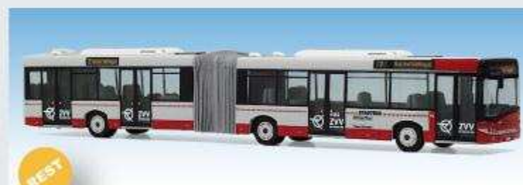
Solaris U18, Stadtbus Winterthur 08701127-1, 14 Bf. Hegi, Wg. 344 08701127-2, 7 Bf. Wülfigen, Wg. 343