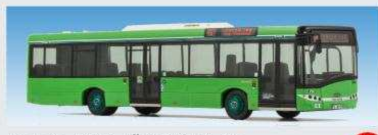
Solaris U12 - ÜWAG Fulda 08701914-1, 20 Tann Rhönhalle, Wg. 712 08701914-2, 40 Fulda ZOB, Wg. 723