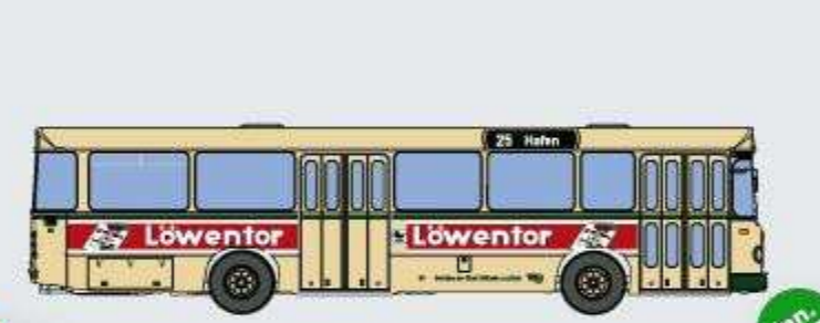
MAN Metrobus 750 HO - Mülheim 08701414-2, 24 Speldorf, Wg. 60 08701414-1, 25 Hafen, Wg. 63 mit Löwentor