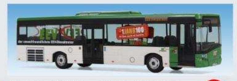
Solaris U12 LE - DHE Harpstedt 08701916, 226 Harpstedt, Wg. 100 (drucktechn. Nachbildung LE-Version)