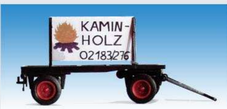
Schilderwagen „Kaminholz“ 08700613