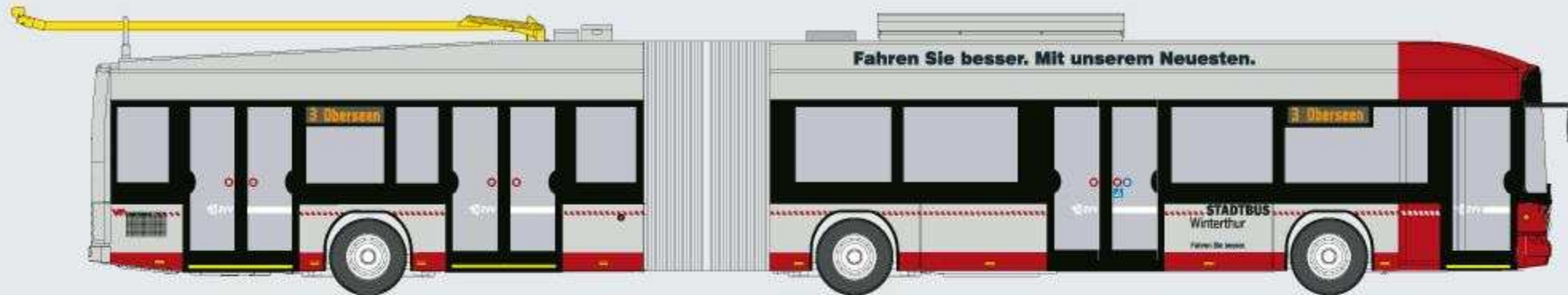
Hess SwissTrolley Stadtbus Winterthur 08701821-1, 3 Oberseen, Wg. 101

Die Carrosserie-Hess AG aus dem schweizerischen Bellach ist Marktführer bei Trolleybussen in der Schweiz. Von VK-Modelle erscheint die Winterthurer Variante.