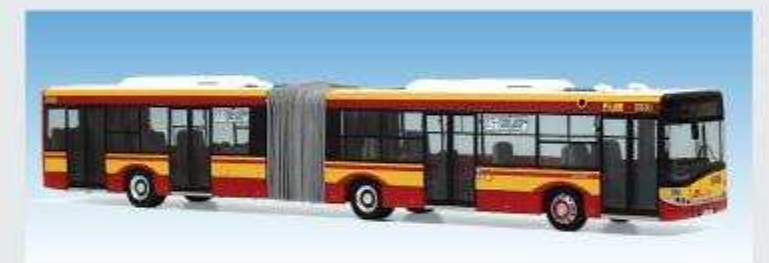
Solaris U18 - MZA Warschau 08701150, 175 Cho. Airport, Wg. 8886