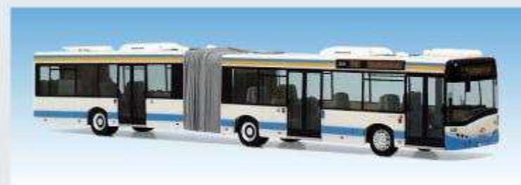
Solaris U18 - Jenaer Verkehrsbetriebe 08701136-1, 10 Stadtzentrum, Wg. 325 08701136-2, 10 Damschkew., Wg. 325