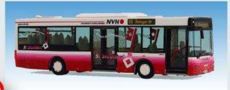
MAN NM 223.2 - NVH Öhringen 08700924, 55 Öhringen Bf.