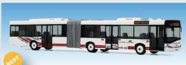
Solaris U18, Rottal Auto AG 08701115-1, Rottal Auto AG, Wg. 23 08701115-3, 61 Ettiswil, Wg. 19