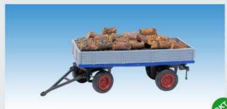
Pritschenwagen mit Brennholzladung 08700624