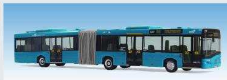
Solaris U18 - VGF Frankfurt 08701129-1, 55 Rödelheim Bf., Wg. 391 08701129-2, 53 Hoechst, Wg. 395