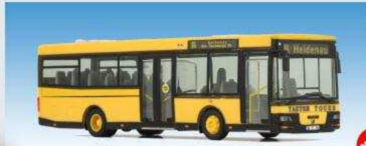
MAN NM 223.2 - Taeter Tours 08700909, 86 Heidenau