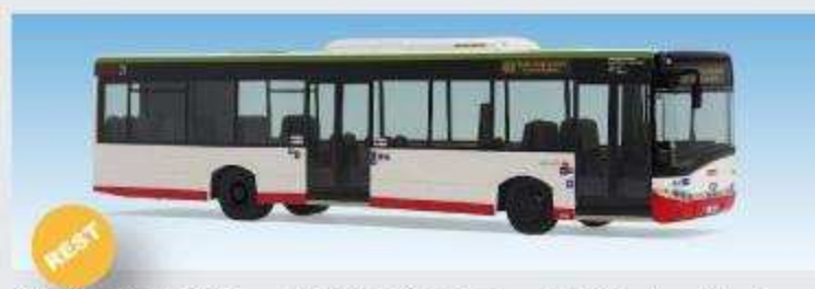
Solaris U12 - DSW Dortmund (kleine Auflage) 08701907-1, 460 Brüninghausen, Wg. 1241 08701907-3, 430 Schwerte, Wg. 1243