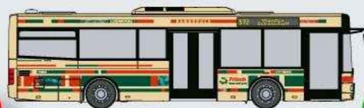
MAN NM 223.2 - Frisch (neue Version) 08700933, 572 Vianden Scheierhaff