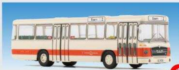
MAN Metrobus 750 HO - VWS Siegen 08701407-1, 1 Siegen Bahnhof, Wg. 158 08701407-2, 2 Eisern, Wg. 159