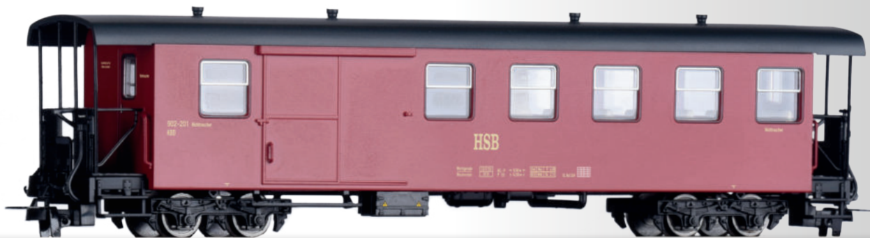
Packwagen KBD der HSB Baggage car KBD of the HSB