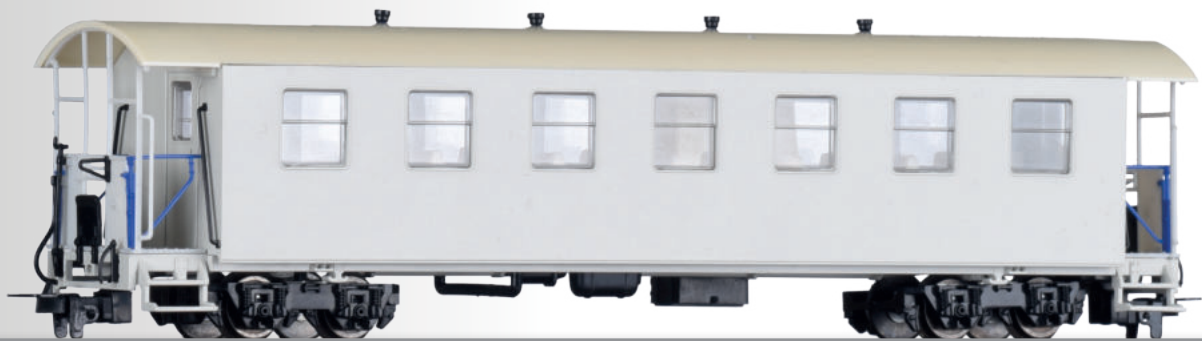
FORMNEUHEIT: Personenwagen KBtr mit Traglastenabteil der HSB NEW: Passenger coach KBtr of the HSB