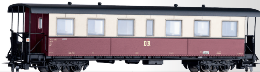
Personenwagen KB4ip der DR Passenger coach KB4ip of the DR