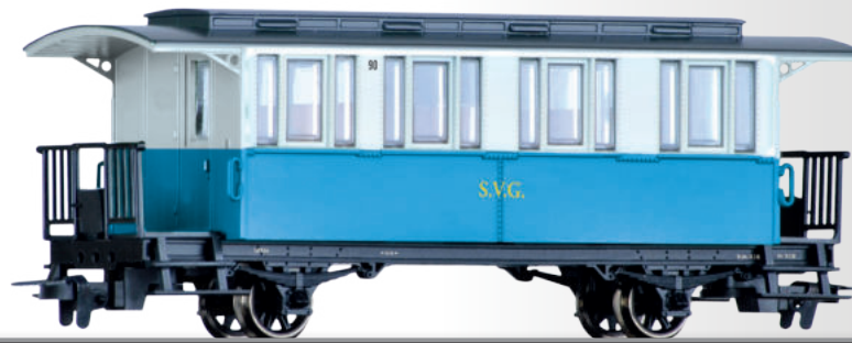
Personenwagen der Sylter Inselbahn Passenger coach of the Sylter Inselbahn