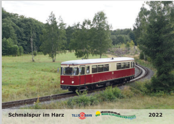
Schmalspur-Kalender 2022 Narrow-gauge calendar 2022