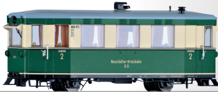
Triebwagen VT1 der NKB Rail car VT1 of the NKB