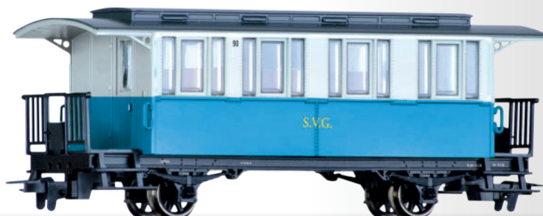
Personenwagen der Sylter Inselbahn Passenger coach of the Sylter Inselbahn