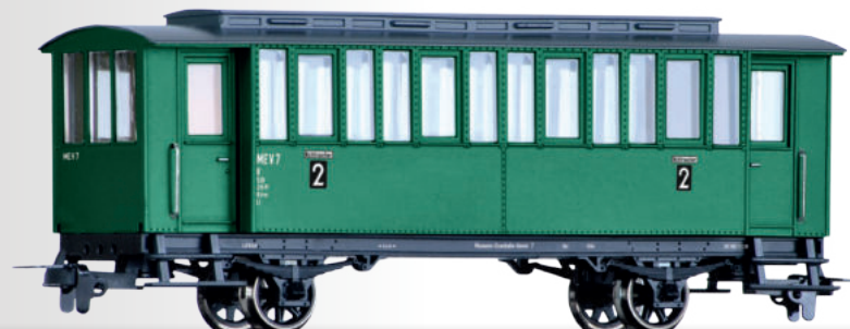
Personenwagenset einer Museumsbahn, bestehend aus drei Personenwagen Passenger coach set of the Museumsbahn with three passenger coaches