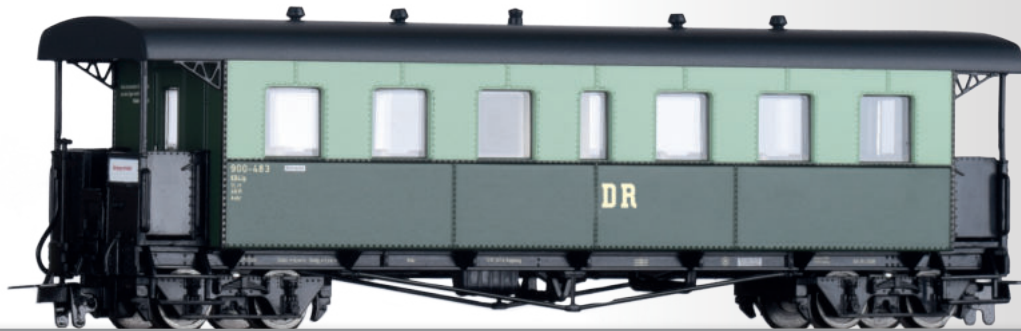
Personenwagen KB4ip „Harzer Roller“ der DR Passenger coach KB4ip "Harzer Roller" of the DR