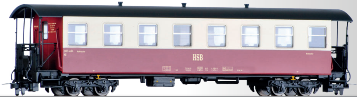
Personenwagen KB der HSB Passenger coach KB of the HSB