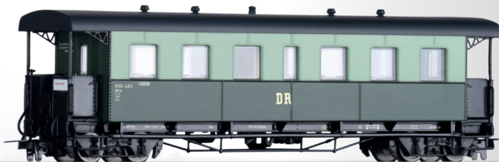
Personenwagen KB4ip „Harzer Roller“ der DR Passenger coach KB4ip "Harzer Roller" of the DR