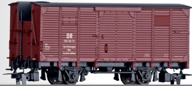
Gerätewagen der DR Service car of the DR