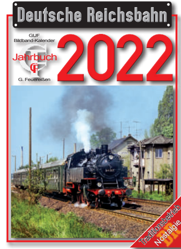
DR-Kalender 2022 DR calendar 2022 (Feuereisen Verlag)