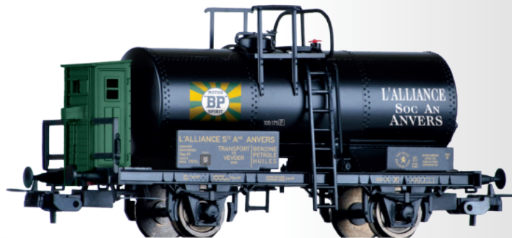
Kesselwagen „BP“, eingestellt bei der SNCB Tank car “BP” of the SNCB