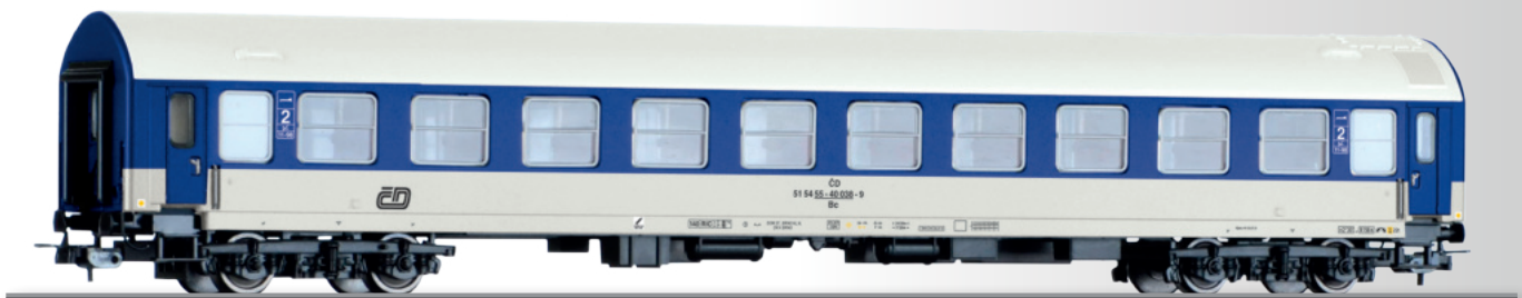
Liegewagen 2. Klasse Bc 841, Typ Y, der ČD 2nd class couchette coach Bc 841, type Y, of the ČD