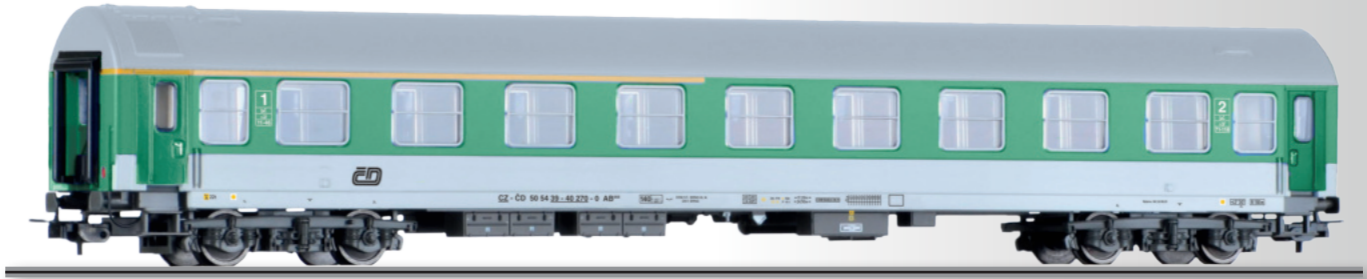
Reisezugwagen 1./2. Klasse AB 350, Typ Y, der ČD 1st/2nd class passenger coach AB 350, type Y, of the ČD