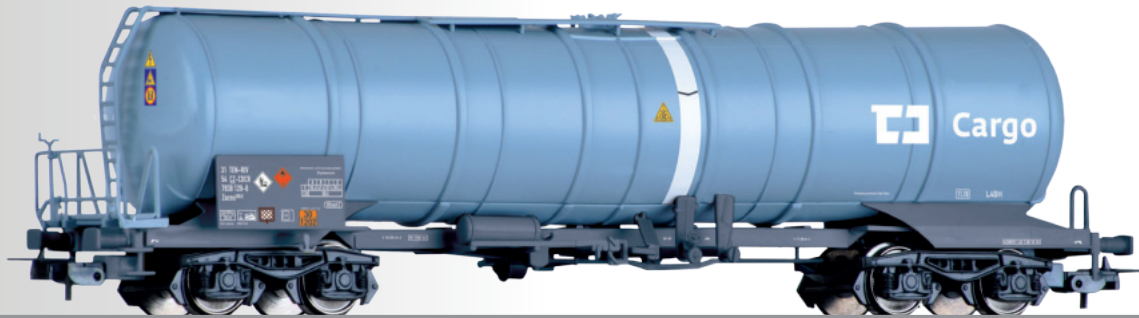
Kesselwagen Zacns der ČD Cargo Tank car Zacns of the ČD Cargo