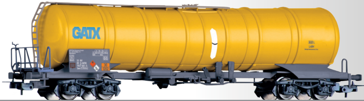
Kesselwagen Zans der GATX Rail Germany GmbH Tank car Zans of the GATX Rail Germany GmbH