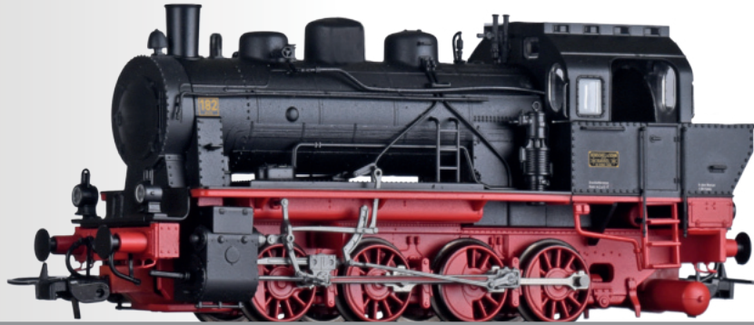
Dampflokomotive Nr. 182 der Görlitzer Kreisbahn AG Steam locomotive No. 182 of the Görlitzer Kreisbahn AG