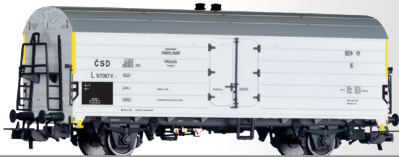
Kühlwagen L der ČSD Refrigerator car L of the ČSD