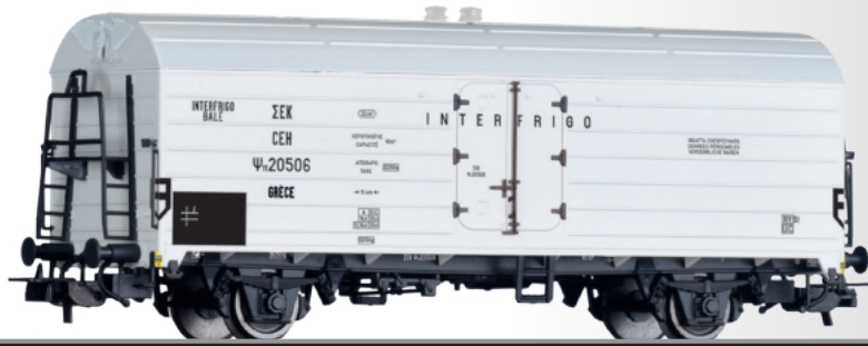
Kühlwagen Ψπ „Interfrigo“, eingestellt bei der SEK (GR) Refrigerator car Ψπ “Interfrigo” of the SEK (GR)