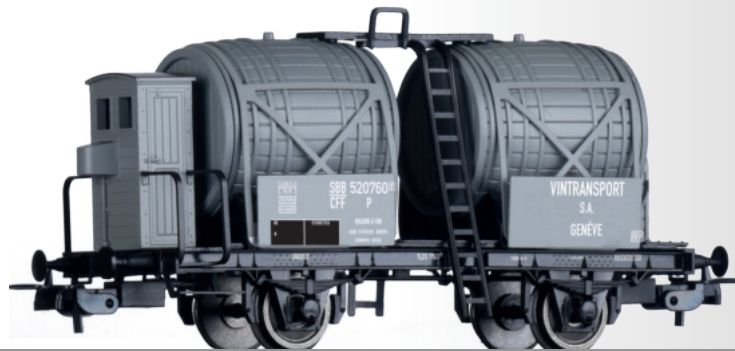
Weinfasswagen „Vintransport S.A. Geneve“, eingestellt bei den SBB Wine barrel car “Vintransport S.A. Geneve” of the SBB