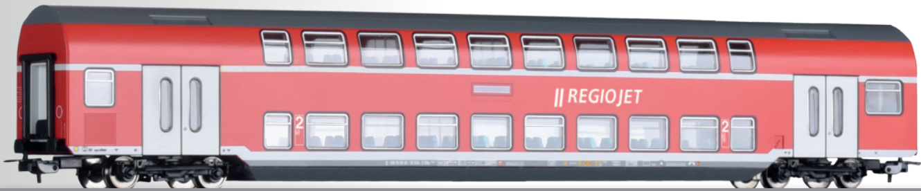
Doppelstockwagen 2. Klasse DBz750 der RegioJet 2nd class double-deck coach DBz750 of the RegioJet