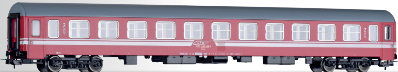
Reisezugwagen 2. Klasse Bmee, Bauart Bautzen, der CFR, 2. Betriebsnummer 2nd class passenger coach Bmee, type Bautzen, of the CFR, 2nd operation number