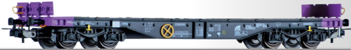
Flachwagen Sgmmns 4505 der ERR Flat car Sgmmns 4505 of the ERR