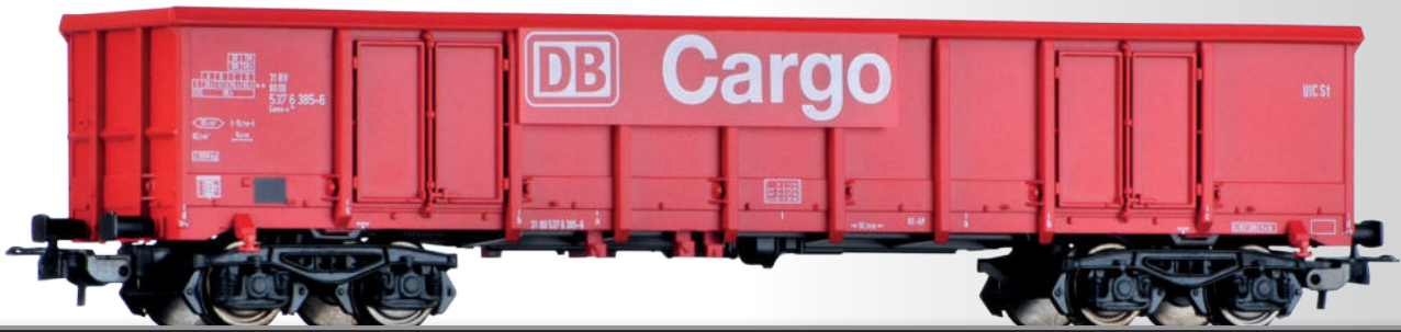
Offener Güterwagen Eanos-x 052 der DB Cargo Open car Eanos-x 052 of the DB Cargo