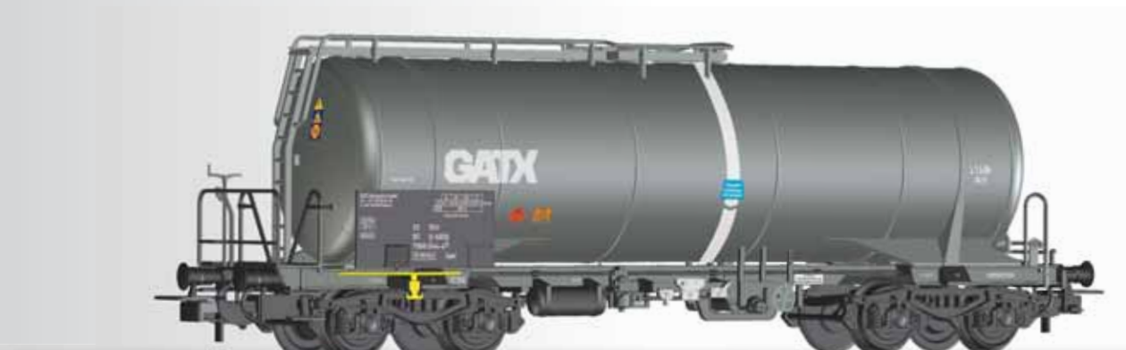
Kesselwagen Zaes der GATX, mit Heizeinrichtung Tank car Zaes of the GATX with heating amatures