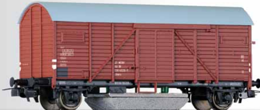
Schienenreinigungswagen der DR Cleaning car of the DR