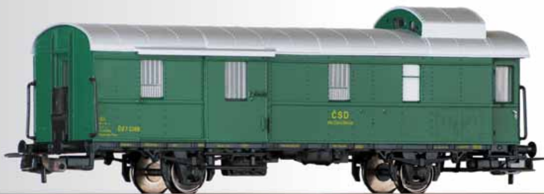
Packwagen Dd (ex. Pwi-31a) der ČSD Baggage car Dd (ex. Pwi-31a) of the ČSD