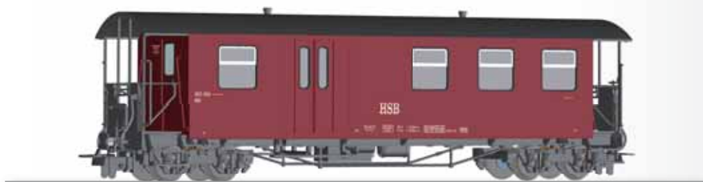
Packwagen KBD der HSB Baggage car KBD of the HSB