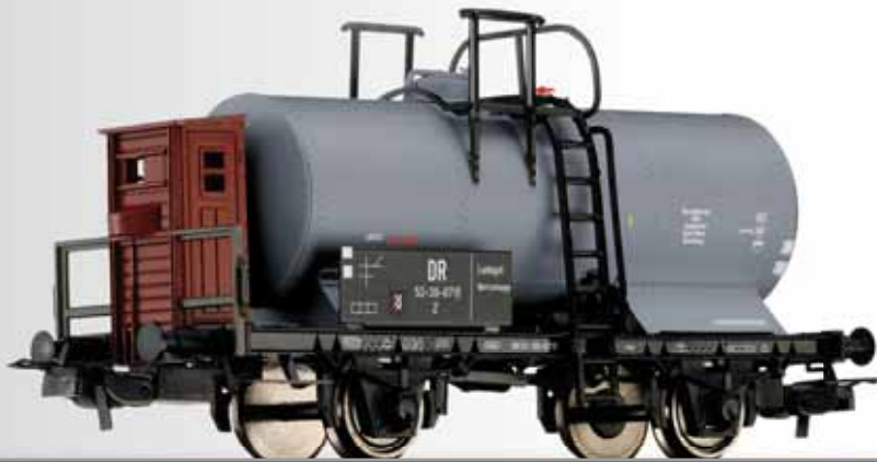
Kesselwagen „VEB Sodawerk Bernburg“ eingestellt bei der DR Tank car „VEB Sodawerk Bernburg“ of the DR