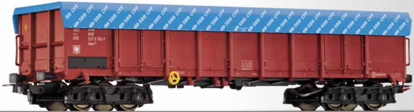
Offener Güterwagen Eanos 052 der DB, mit Plane Open car Eanos of the DB with tarpaulin