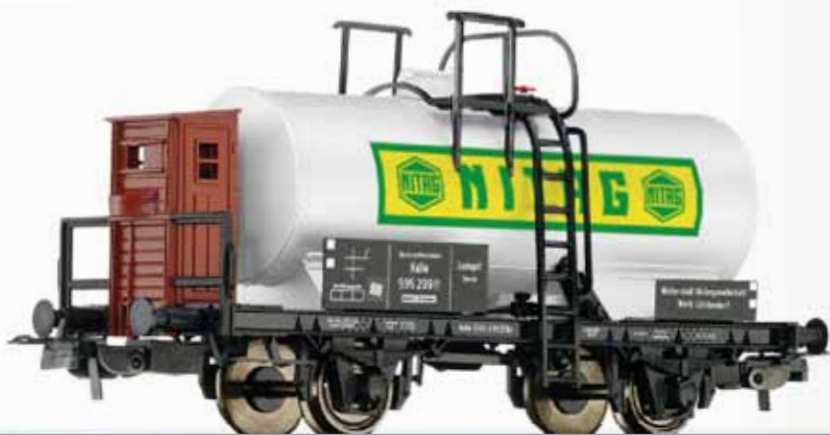
Kesselwagen „NITAG“, eingestellt bei der DRG Tank car „NITAG“ of the DRG