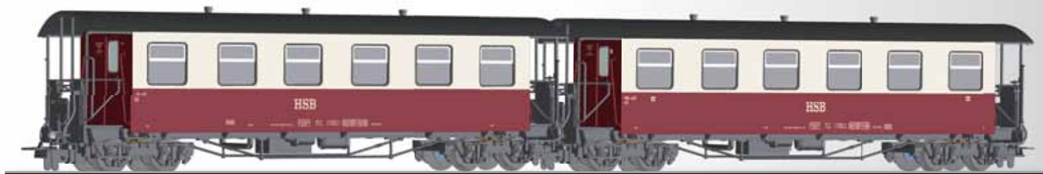
Personenwagenset, bestehend aus zwei Schmalspur-Personenwagen KB der HSB Passenger coach set with two passenger coaches KB of the HSB