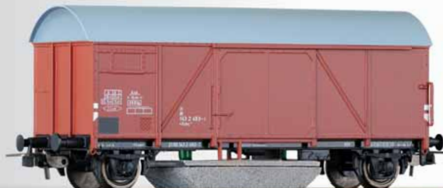
Schienenreinigungswagen der DB Cleaning car of the DB