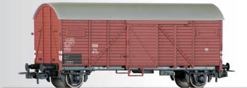
Gedeckter Güterwagen Gms der ÖBB Box car Gms of the ÖBB