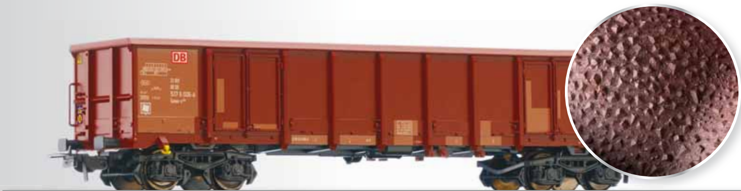
Offener Güterwagen Eanos-x 052 der DB AG, mit Erzladung Open car Eanos-x 052 of the DB AG loaded with ore