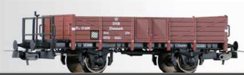
Offener Güterwagen PER (ex. Halle) der DSB Open car PER (ex. Halle) of the DSB