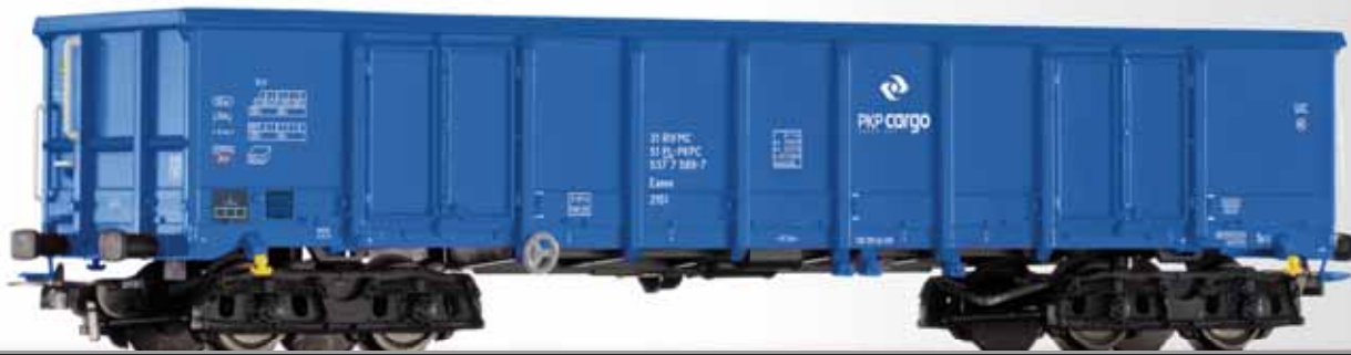
Offener Güterwagen Eanos der PKP Cargo Open car Eanos of the PKP Cargo