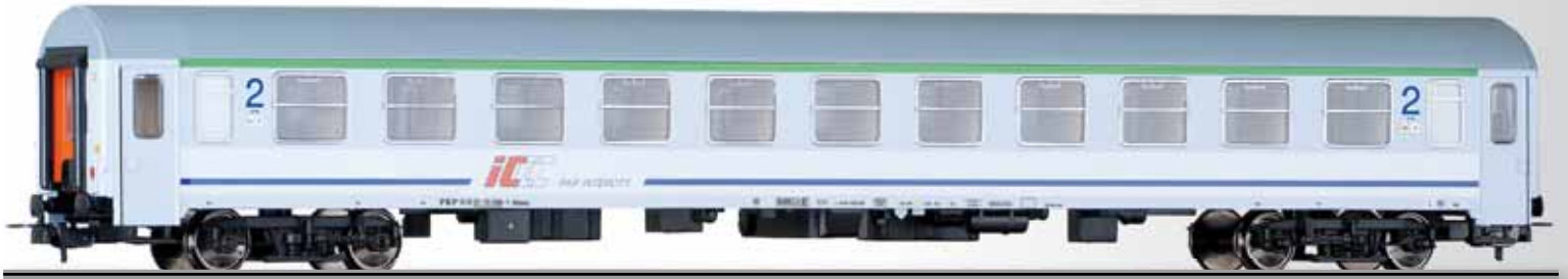
Reisezugwagen 2. Klasse Bdmu der PKP INTERCITY 2nd class passenger coach Bdmu of the PKP INTERCITY