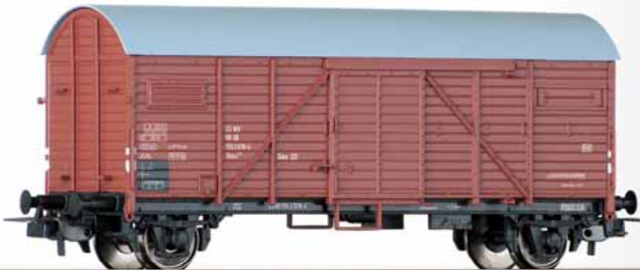
Gedeckter Güterwagen Glm 201 (ex. G Bremen) der DB Box car Glm 201 (ex. G Bremen) of the DB