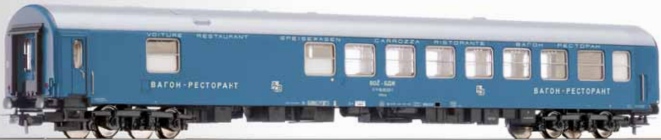
Speisewagen 2. Klasse WRme der BDZ, Bauart Bautzen 2nd class dining coach WRme of the BDZ, type Bautzen