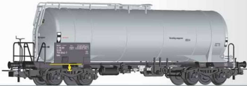
Kesselwagen Uahs der DR mit Heizeinrichtung Tank car Uahs of the DR with heating amatures