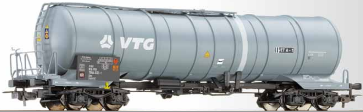
Kesselwagen Zans der VTG Tank car Zans of the VTG