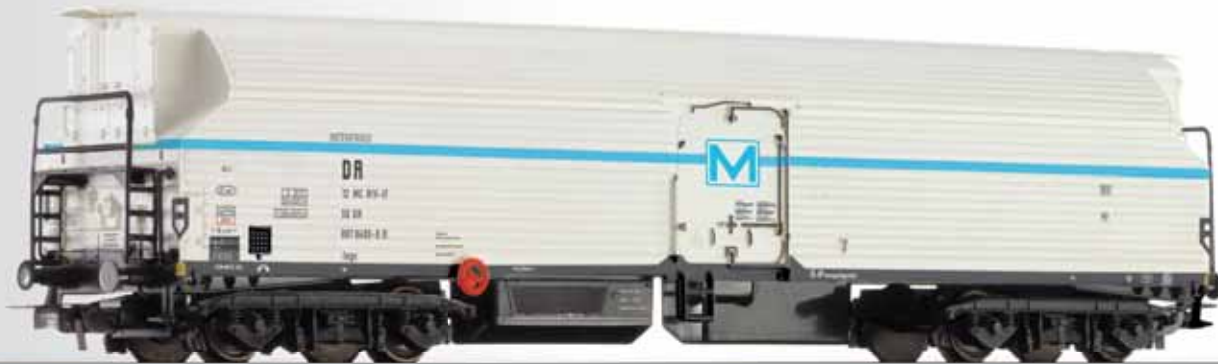
Maschinenkühlwagen der INTERFRIGO, eingestellt bei der DR Mechanical refrigerator waggon of the INTERFRIGO