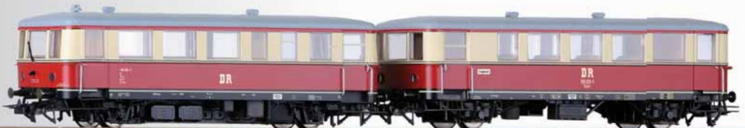
Triebwagen BR 183 mit Beiwagen BR 190 der DR Railbus class 183 with trailer car class 190 of the DR