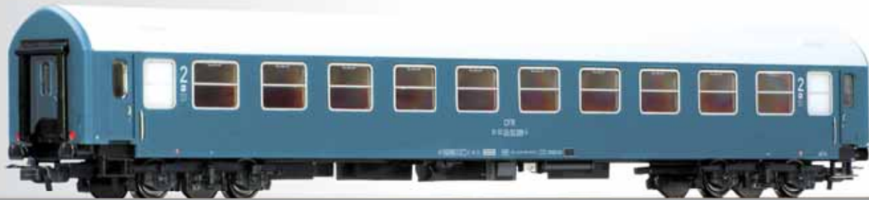
Reisezugwagen 2. Klasse, Typ Y/B 70, der CFR 2nd class passenger coach, type Y/B 70, of the CFR