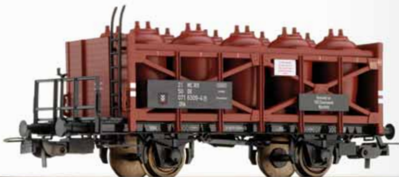
Säuretopfwagen Uhk „VEB Chemiewerk Nünchritz“, eingestellt bei der DR Acid pot car Uhk VEB „Chemiewerk Nünchritz“ of the DR