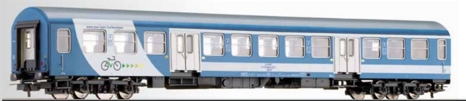
Reisezugwagen 2. Klasse Bydee der MAV-Start 2nd class passenger coach Bydee of the MAV-Start