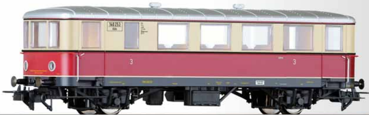
Beiwagen Cpostv-35 der DRG Trailer car Cpostv-35 of the DRG