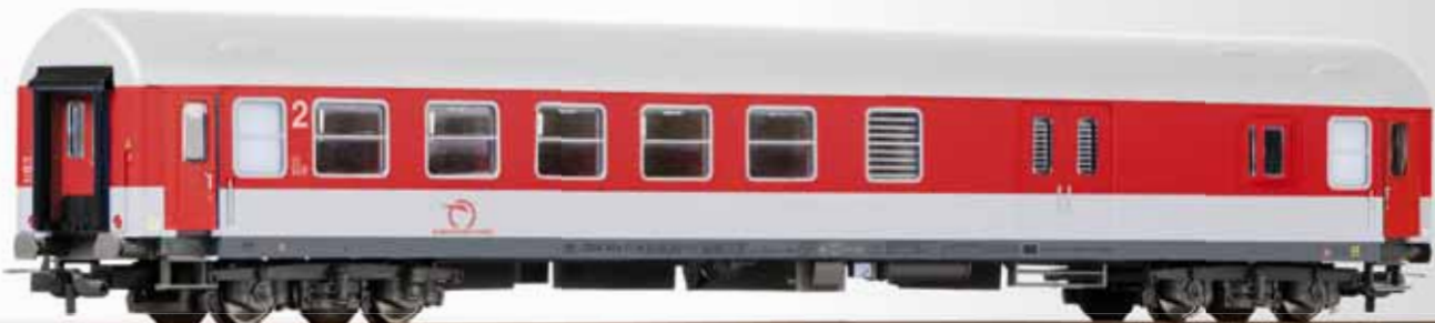
Sitz-/Gepäckwagen, Typ Y/B 70, der ZSSK 2nd class baggage car, type Y/B 70, of the ZSSK