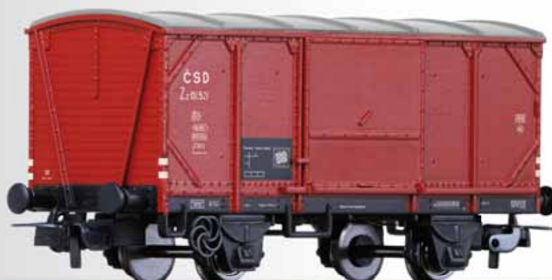
Gedeckter Güterwagen Zz (ex. USTC) der ČSD Box car Zz (ex. USTC) of the ČSD