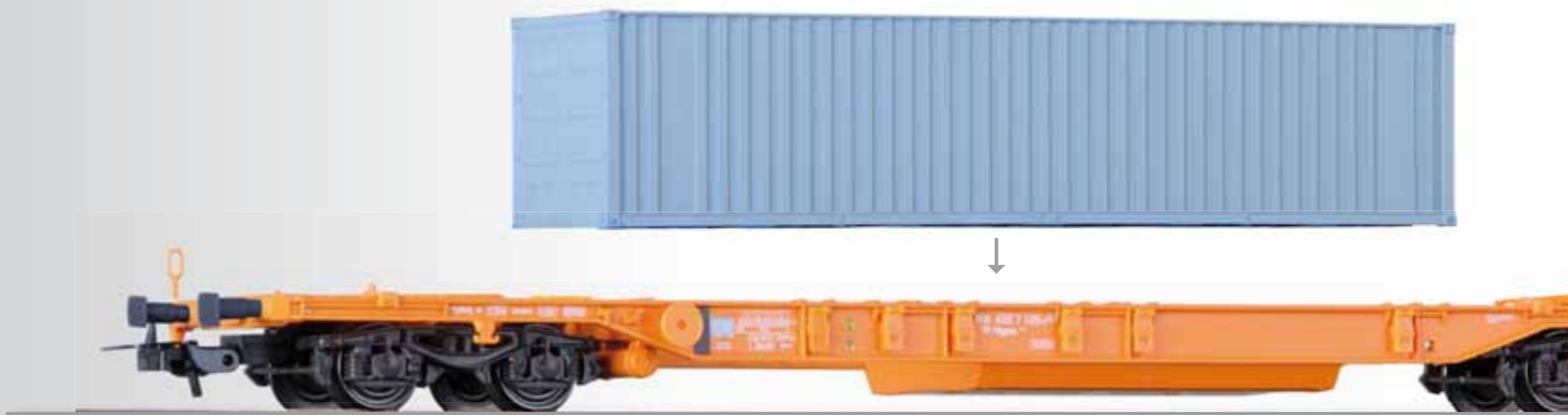
Doppeltragwagen Sdggmrs 744 „Kombiwaggon“ der DB AG, beladen mit zwei 20" Container „Hapag Lloyd“ und einem 40" Container „China Shipping“ / Container car Sdggmrs 744 of the DB AG with two 20" containers „Hapag Lloyd“ and one 40" container „China Shipping“