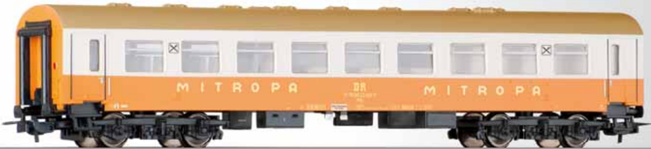
Speisewagen „Städteexpress“ der DR Dining coach „Städteexpress“ of the DR