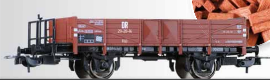
Offener Güterwagen (ex. Halle) der DR, beladen mit Ziegel Open car (ex Halle) of the DR with load