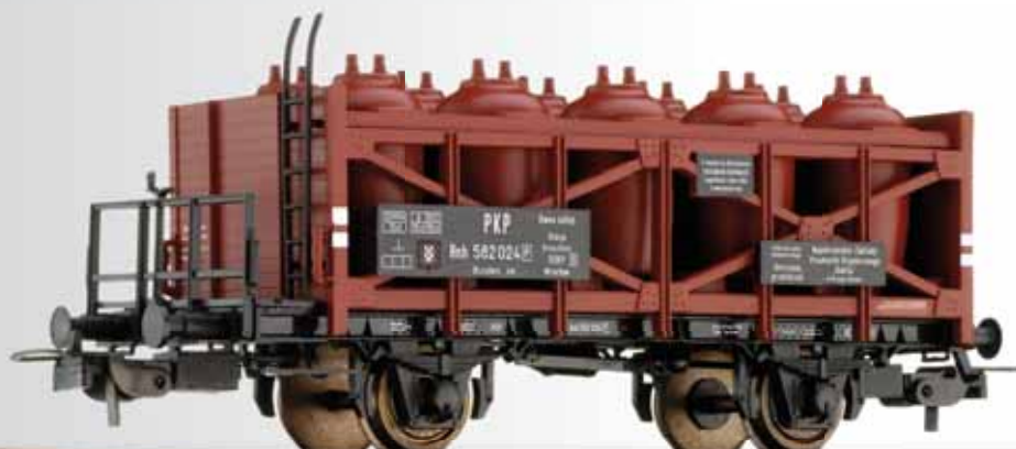
Säuretopfwagen Rnh „Rokita“ der PKP Acid pot car Rnh „Rokita“ of the PKP