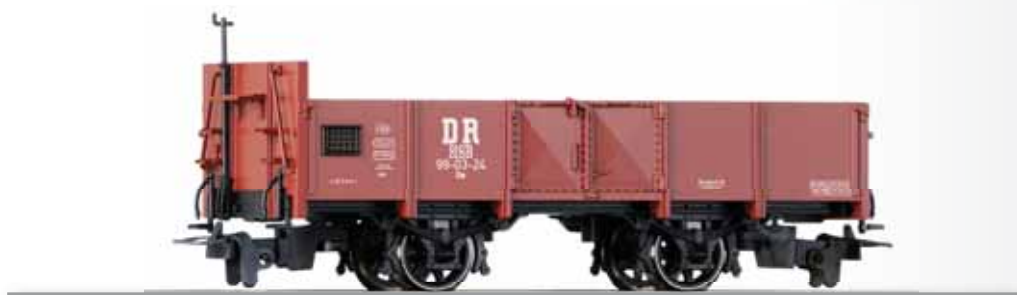
FORMÄNDERUNG / NEW: Offener Güterwagen Ow der HSB Open box car Ow of the HSB