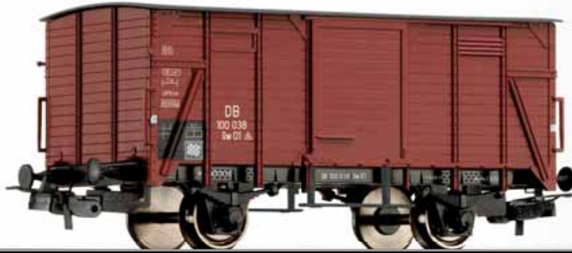
Gedeckter Güterwagen G 01 (ex. Magdeburg) der DB Box car G 01 (ex. Magdeburg) of the DB