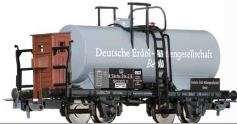
Kesselwagen „DEA“, eingestellt bei der K.Sächs.Sts.E.B. Tank car „DEA“ of the K.Sächs.Sts.E.B.