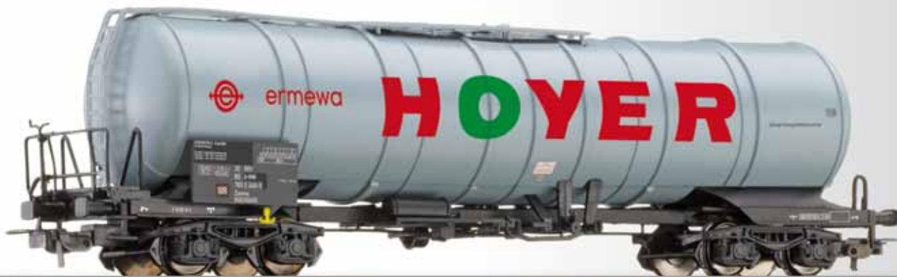
Kesselwagen Zaens „HOYER“ der ERMEWA Tank car Zaens „HOYER“ of the ERMEWA