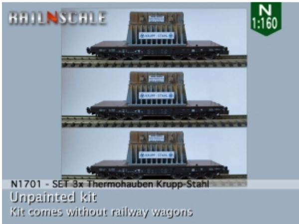
N1701 - SET 3x Thermohauben Krupp-Stahl Unpainted kit Kit comes without railway wagons