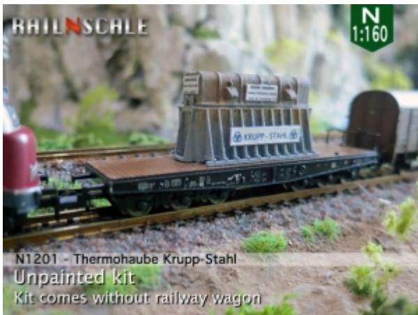
N1201 - Thermohaube Krupp-Stahl Unpainted kit Kit comes without railway wagon