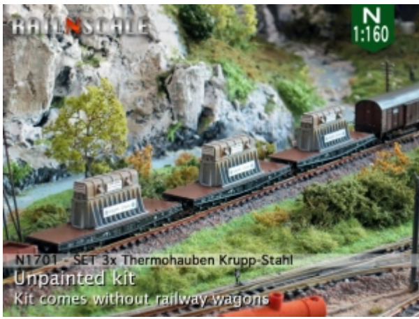
N1701 - SET 3x Thermohauben Krupp-Stahl Unpainted kit Kit comes without railway wagons