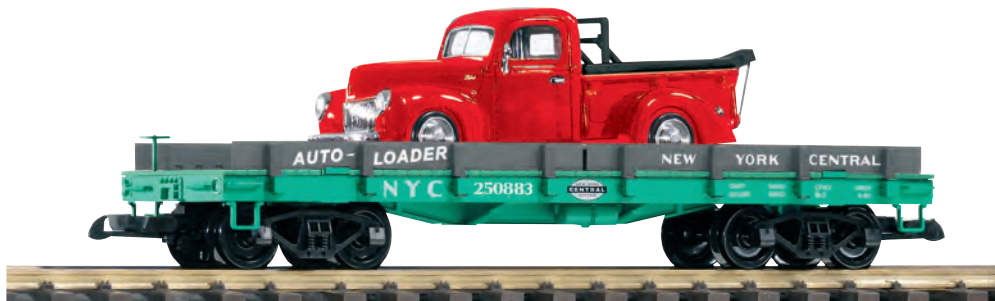
38752 Autotransportwagen NYC mit 1940 Ford Abschleppwagen NYC Auto Transport with Diecast 1940 Ford Tow Truck