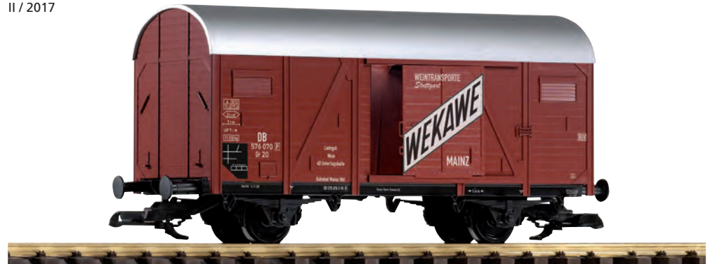
37953 Gedeckter Güterwagen WEKAWE DB Ep. III, Türen zum Öffnen DB III 2-Axle Boxcar WEKAWE, doors can be opened