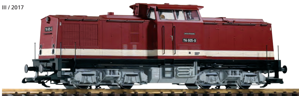
37567 Diesellokomotive BR 114 DR Ep. IV DR IV Diesel Loco BR 114