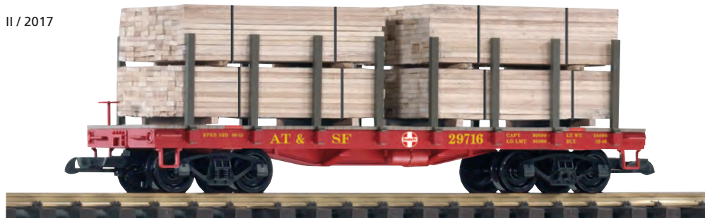
38740 Rungenwagen SF mit Holzladung SF Flatcar w/Lumber Load