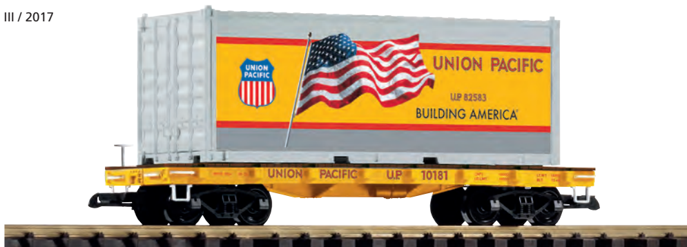
38750 Containertragwagen UP UP Container Car