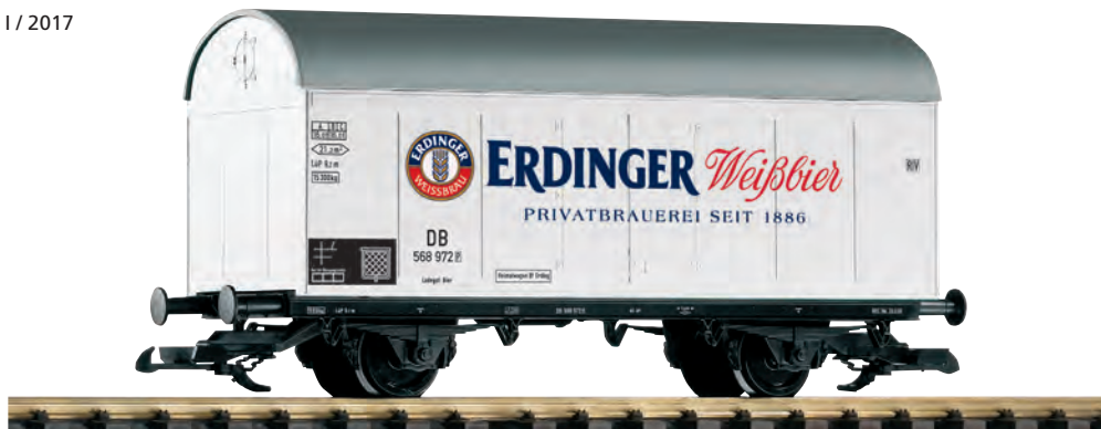
37952 Bierwagen „Erdinger“ DB Ep. III DB III "Erdinger" Beer Reefer