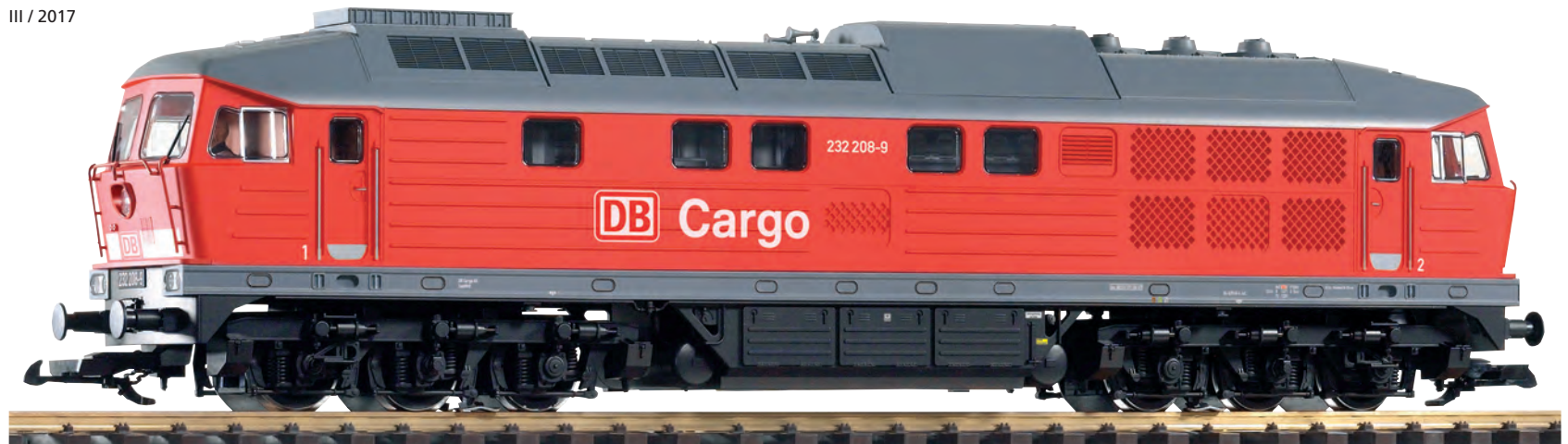
37581 Diesellokomotive BR 232 DB Cargo Ep. V DB Cargo V BR 232 Diesel Loco