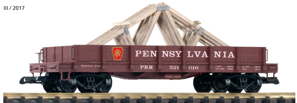
38754 Niederbordwagen PRR mit Dachbindern PRR Low-Side Gondola with Roof Trusses