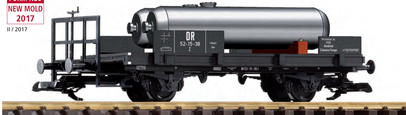
37830 Behelfskesselwagen DR Ep. III DR III 2-Axle Flatcar with tank