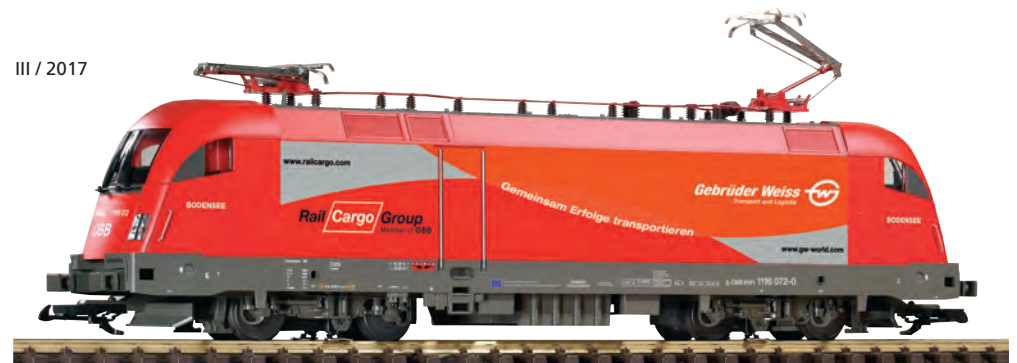
37428 E-Lok Taurus 1116 072-0 „Gebrüder Weiss“ ÖBB Ep. VI OEBB VI Taurus Electric Loco 1116 072-0 "Gebrüder Weiss"