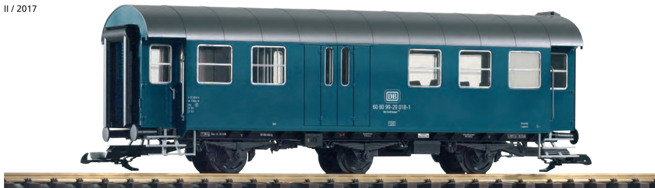
37610 Werkstattwagen 414 DB Ep. IV DB IV Workshop Car 414