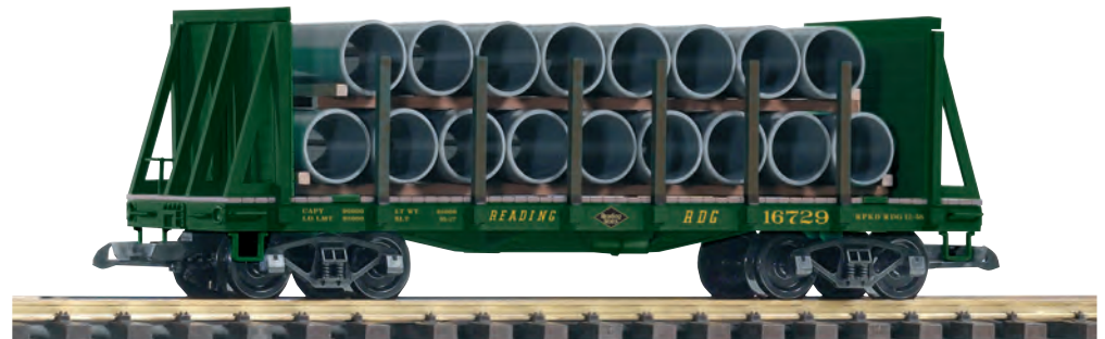
38756 Rungenwagen RDG mit Ladung RDG Bulkhead Flatcar with Pipe Load