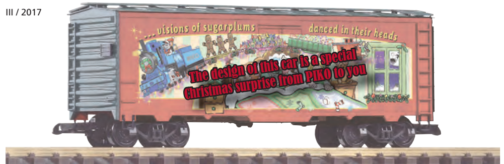
38875 Weihnachtswagen 2017 2017 Christmas Car