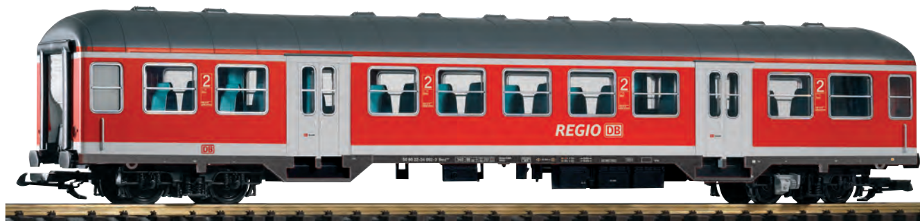
37628 Nahverkehrswagen Bnrz 451.4, 2. Klasse, DB AG Ep. VI DB AG VI Silver Coin Coach Bnrz 451.4, 2. cl.