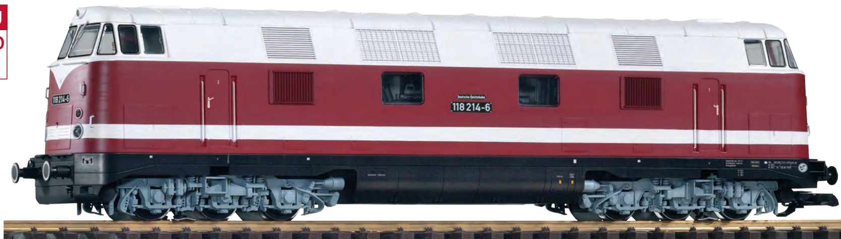
37570 Diesellokomotive BR 118 DR Ep. IV DR IV BR 118 Diesel Loco