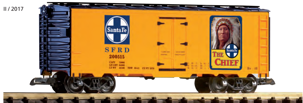
38878 Güterwagen SF, 200515 SF Steel Boxcar 200515