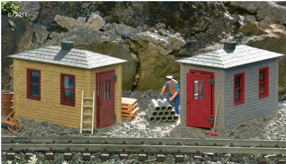
II / 2017 62718 Gleisbauhütten, 2 Stück Railroad Tool Shed, set of 2