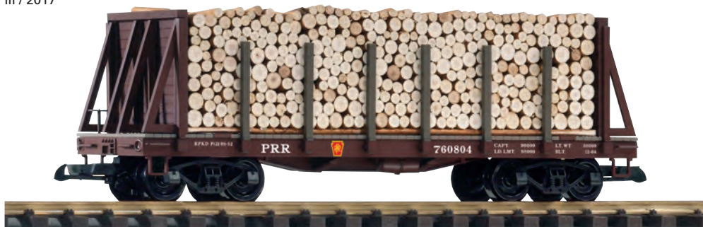
38755 Rungenwagen PRR mit Ladung PRR Bulkhead Flatcar with Pulpwood Load