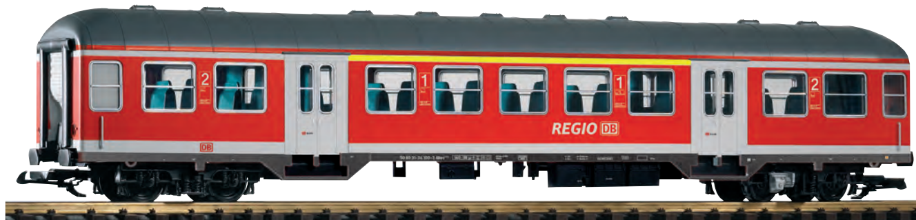
37629 Nahverkehrswagen ABnrz 418.4, 1./2. Klasse, DB AG Ep. VI DB AG VI Silver Coin Coach ABnrz 418.4, 1./2. cl.