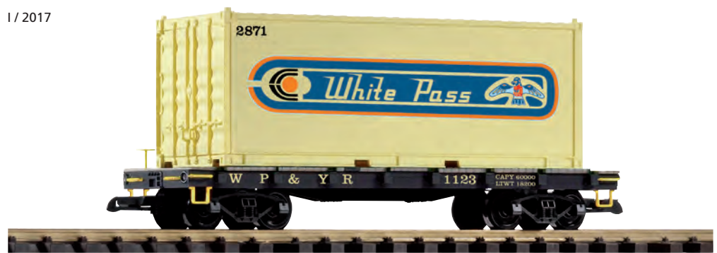
38751 Containertragwagen WP&YR WP&YR Container Car