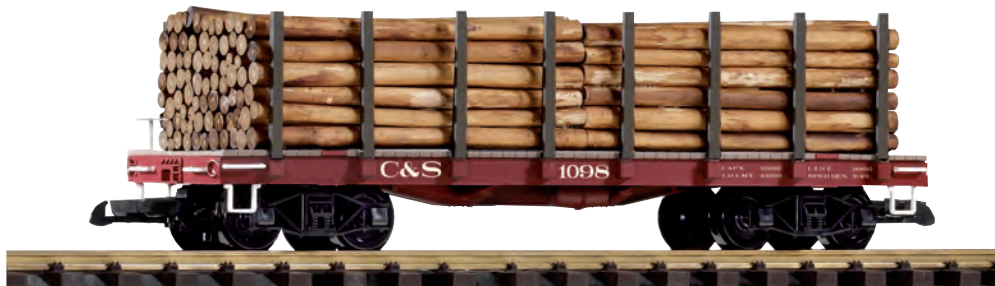
38745 Rungenwagen C&S mit Holzladung C&S Flatcar with Log Load