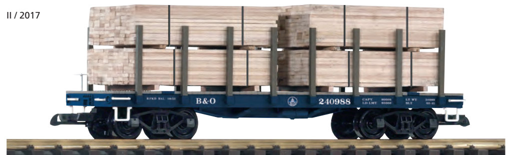
38741 Rungenwagen B&O mit Holzladung B&O Flatcar w/Lumber Load