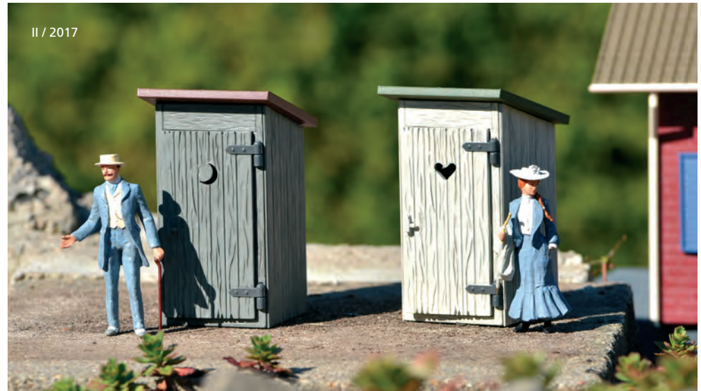
II / 2017 62719 Toilettenhäuschen, 2 Stück Outhouse, set of 2