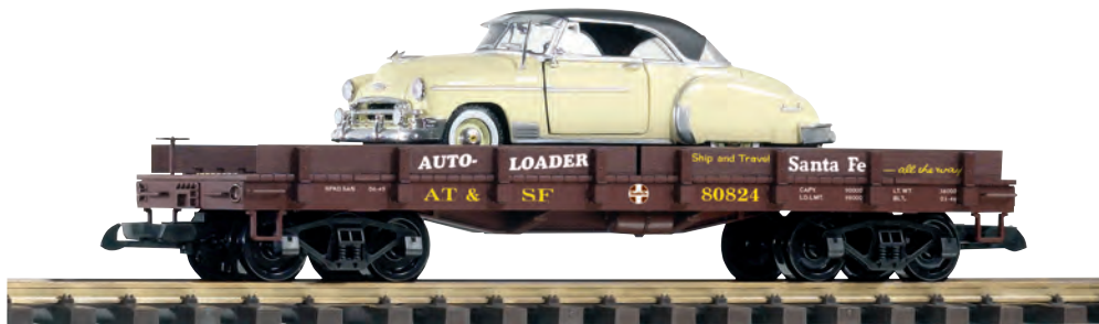
38746 Autotransportwagen SF mit 1950 „Chevy Bel Air“ SF Auto Transport with Diecast 1950 Chevy Bel Air