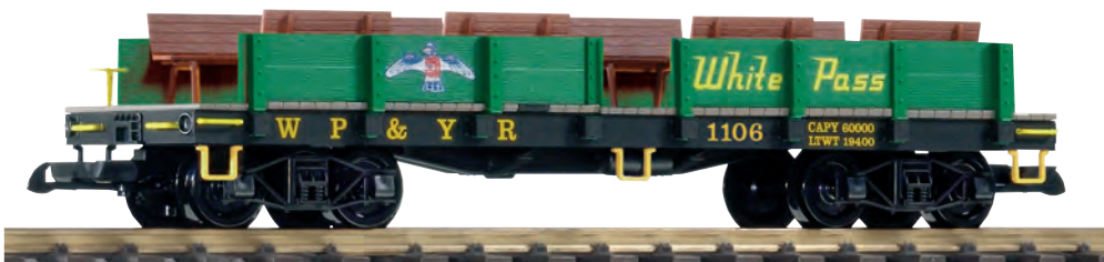
38753 Aussichtswagen WP&YR mit Bänken WP&YR Sightseeing Car with Bench Seats