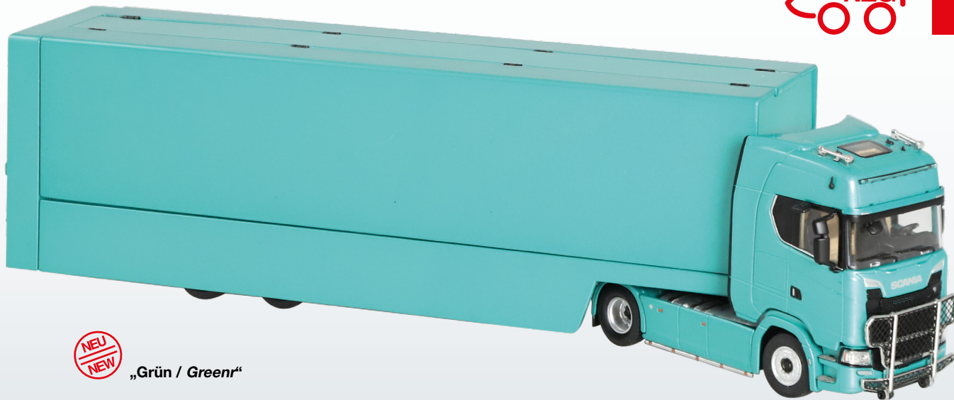
Scania V8 730 S & Autotransporter / Car transporter

Maßstab / Scale : 1:64 Länge / Length : 270 mm