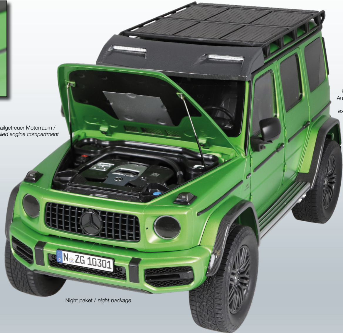
Klappbarer Außenspiegel / foldable exterior mirror