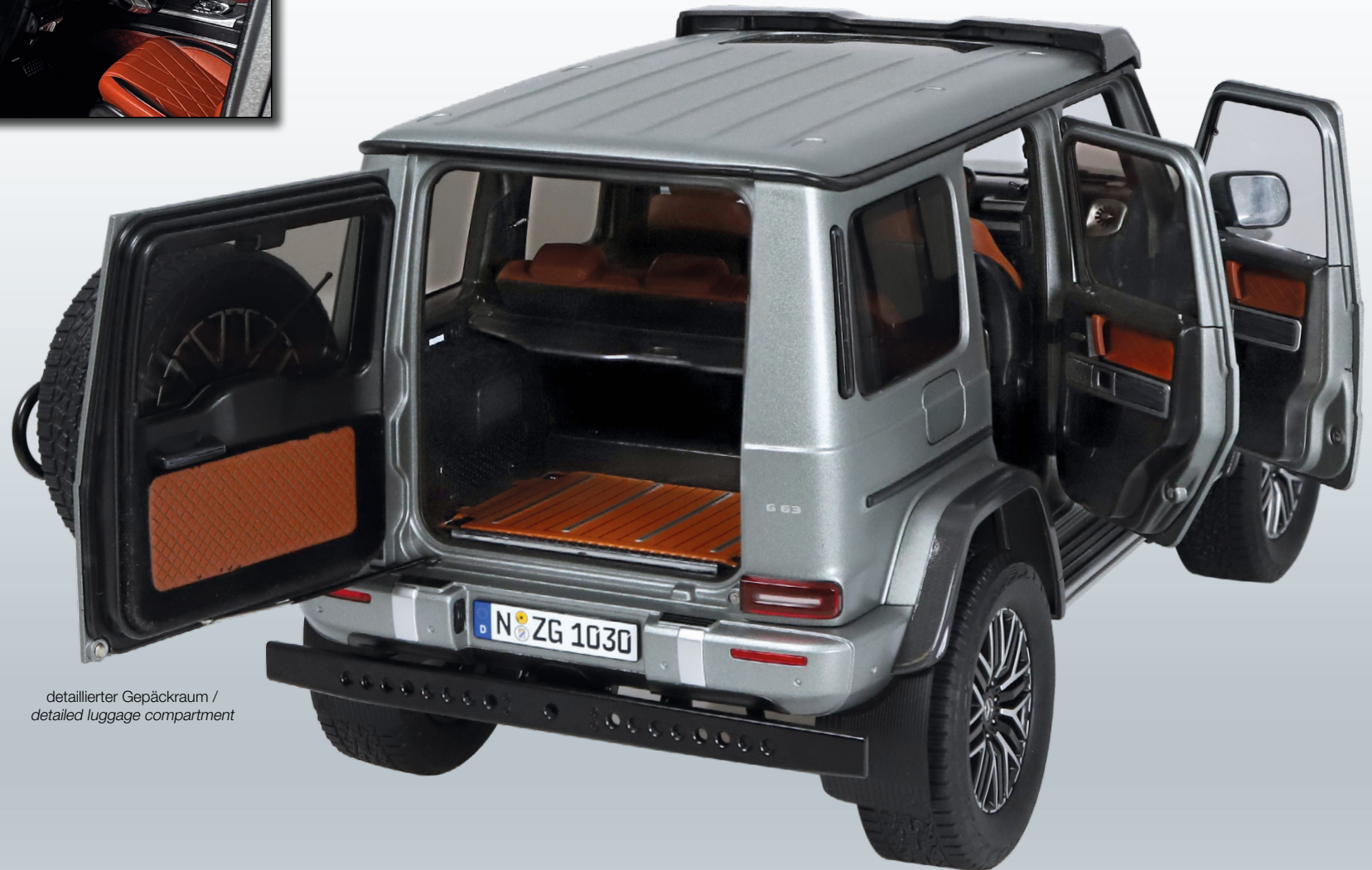
detaillierter Gepäckraum / detailed luggage compartment