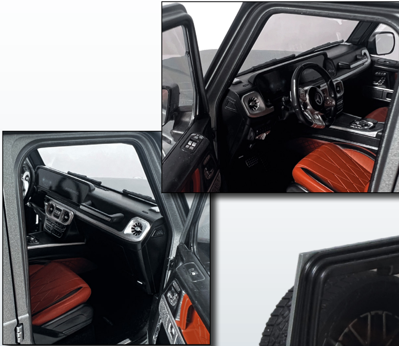
hochdetaillierte Innenausstattung / highly detailed interior