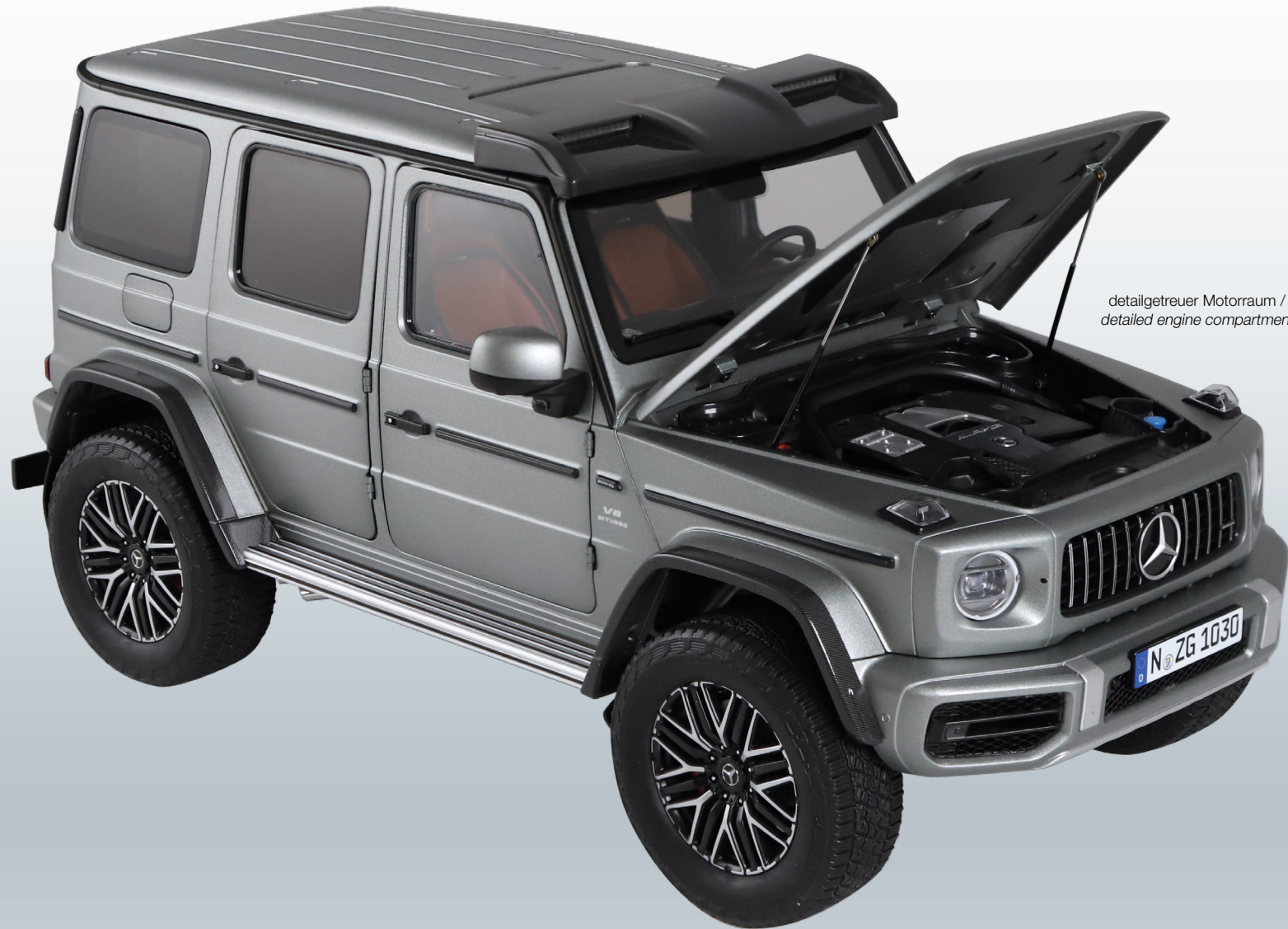
detailgetreuer Motorraum / detailed engine compartment