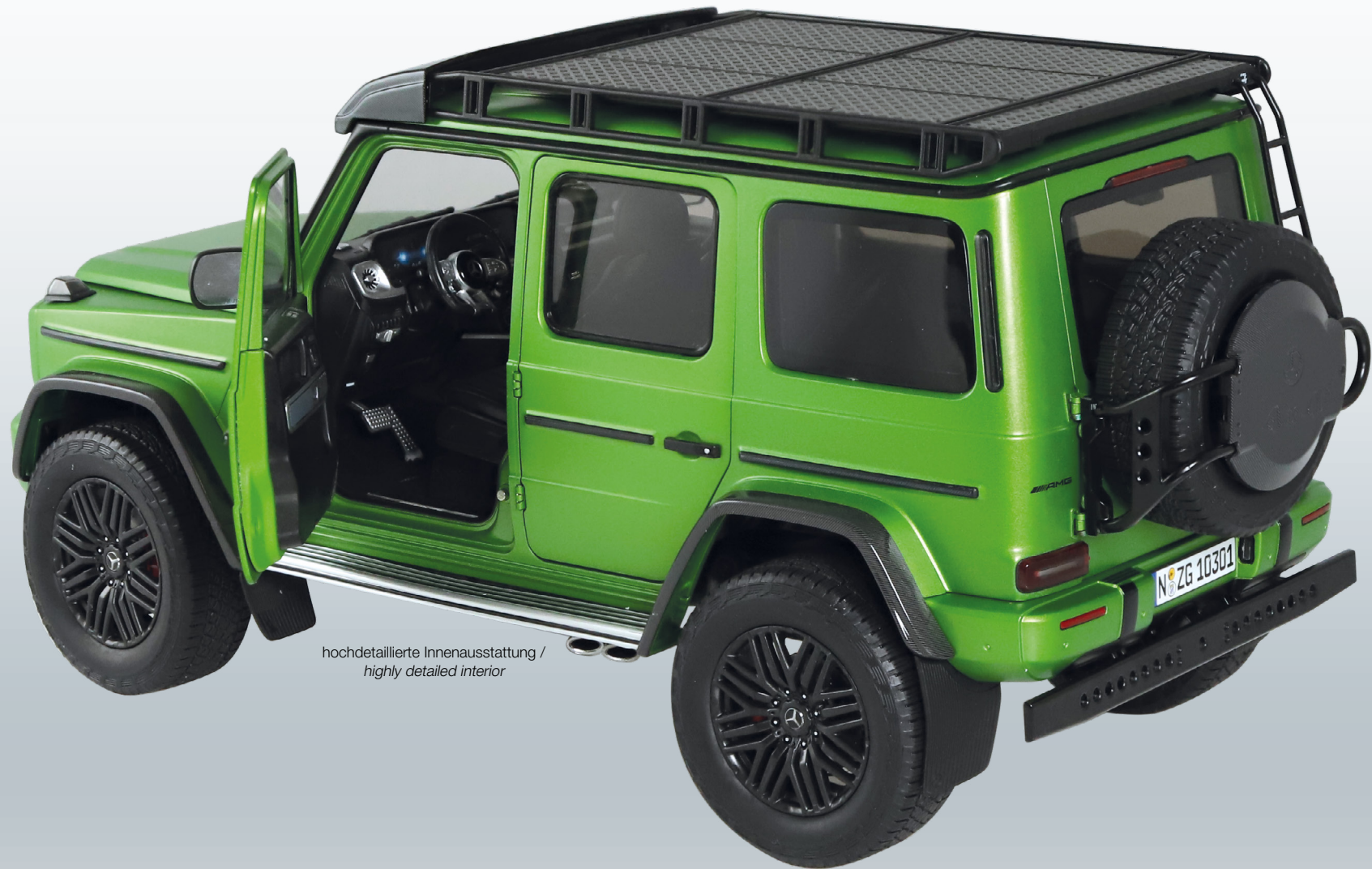
hochdetaillierte Innenausstattung / highly detailed interior