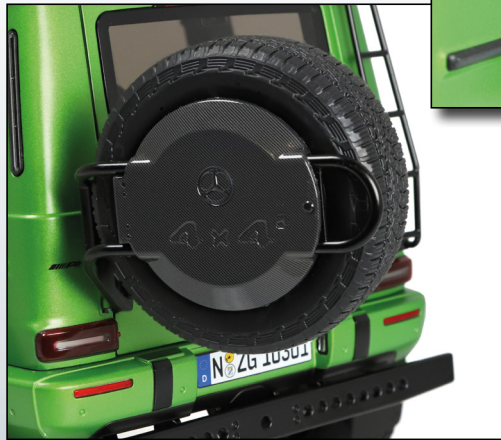
schwenkbarer Reserveradhalter / swivelling spare wheel holder