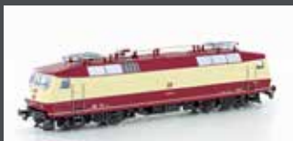
LS16082 E-LOK BR 120 005-4 DB EP.IV ROT/BEIGE DB LOGO VORSERIE