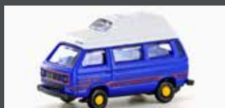
LC4350 VW T3 WESTFALIA CAMPER (METALLIC SERIE)