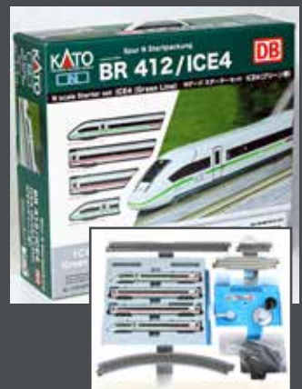
K10960 ICE4, 4-TLG. DBAG/ KLIMASCHÜTZER, STARTSET GLEIS-OVAL, TRAFU