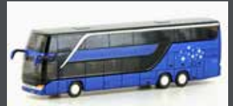
LC4488 SETRA S 431DT REISEBUS NEUTRAL, METALLIC BLAU