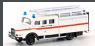
LC4223 MAN LF 16-TS GERÄTEWAGEN DRK