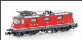
H3026 E-LOK RE 4/4 II 11133 SBB, EP.IV-V, EX. SWISS EXPRESS