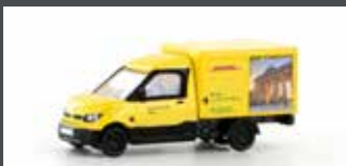
LC4556 STREETSCOOTER WORK "DHL BERLIN" 1:160