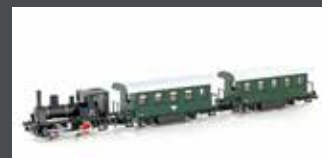
K105003 DAMPFLOK SET 3TLG. VORBILD ÖBB BR 88 SCHWARZ/GRÜN