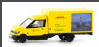
LC4561 STREETSCOOTER WORK-L "DHL DÜSSELDORF" 1:160