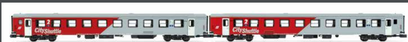
NEM IV JC60290 2ER SET REISEZUGWAGEN ÖBB EP. VI CITY SHUTTLE