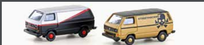
LC4344 VW T3 2ER SET TUNING (METALLIC SERIE)