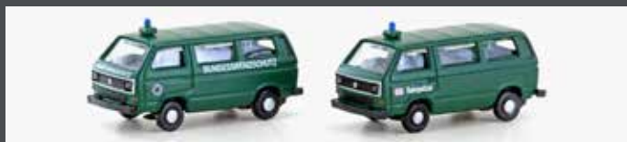
LC4353 VW T3 2ER SET BGS / BAHNPOLIZEI