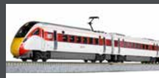
K101674 TRIEBZUG CLASS 800/2 LNER / AZUMA, 5-TLG., EP.VI