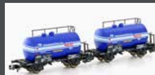
H24851 2ER SET LEICHTBAU-KESSELWAGEN PKP/PETRO-CHEMIA, EP.IV/V