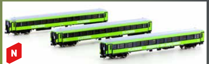
LC95006 3ER SET PERSONENWAGEN BMMZ FLIXTRAIN, EP.VI, NEUES DESIGN