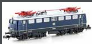
H28111 E-LOK E10.1 DB, EP.III, BLAU / SCHWARZ