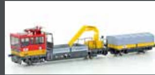
H23567 GLEISKRAFTWAGEN ROBEL X552 ÖBB, EP.V-VI, MOTORISIERT