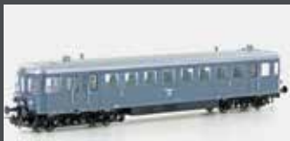
JC23030 TRIEBWAGEN VT 923 DRG, EP.II, GRAU JC23032 SOUND