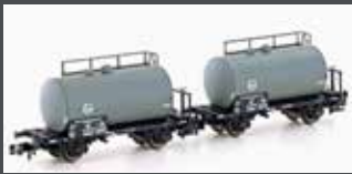
H24801 2ER SET LEICHTBAU-KESSELWAGEN DB/EVA, EP.III