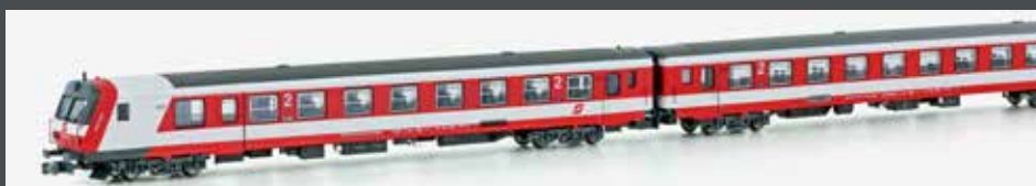
NEM 651 VI

JC60360 3-TLG. SET WENDEZUG-SET EP IV * STEUERWAGEN MIT LICHTWECHSEL * 6PIN SCHNITTSTELLE * 2X 2.KLASSEWAGEN * MAV-LACKIERUNG