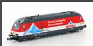
K137123 E-LOK SBB RE4/4 460 COOP PRO MONTAGNA EP.IV-V