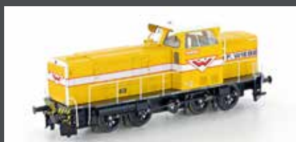
HE10021571 DIESELLOK MAK 650D WIEBE EP.IV DC ANALOG