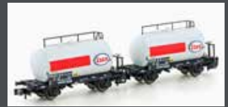
H24832 2ER SET LEICHTBAU-KESSELWAGEN DB/ESSO, EP.IV