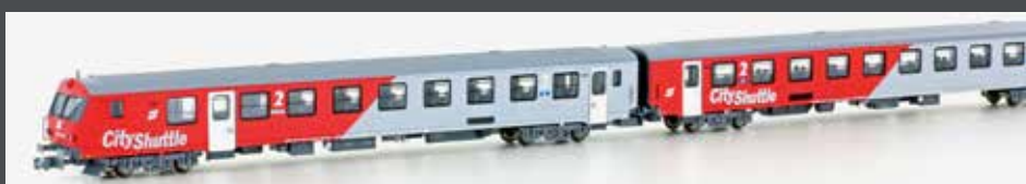
NEM 651 VI

JC60380 3ER SET REISEZUGWAGEN ÖBB EP. VI CITY SHUTTLE