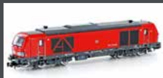
H3111 DIESELLOK BR 247 902 DB CARGO, EP.VI H3111S MIT SOUND