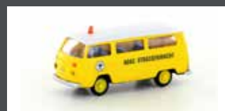
LC3924 VW T2 BUS "ADAC"