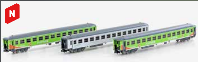
LC95004 FLIXTRAIN SET 4 3ER SET PERSONENWAGEN BIMZ 264, EP.VI