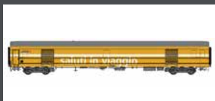
LS47283 POSTWAGEN TYP Z SBB, EP.VI, GELB/WEISS "SALUTI IN VIAGGIO"