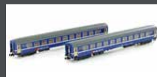
K23010 2ER SET RIC LIEGEWAGEN BCM SBB, EP.IV-V