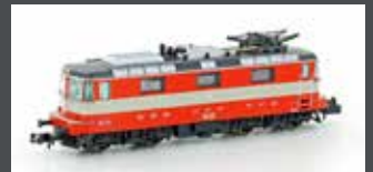
H3022 E-LOK RE 4/4 II 1.SERIE SBB, SWISS EX., EP. III-IV