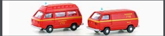
LC4342 VW T3 2ER SET FEUERWEHR