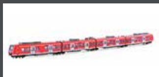
K101716 TRIEBZUG ET 425, 4-TLG. DB REGIO, EP.V-VI, NEUTRAL