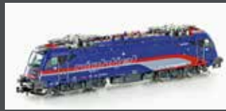
H2737S E-LOK RH 1216 012 TAURUS ÖBB NIGHTJET, EP.VI, SOUND