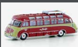
LC4454 SETRA S8 KNECHT REISEN (CH)