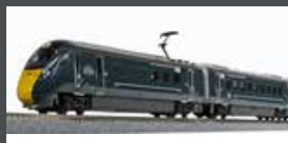
K101671 TRIEBZUG CLASS 800/0 GWR, 5-TLG., EP.VI