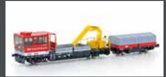
H23568 GLEISKRAFTWAGEN ROBEL TM234 SOB, EP.V-VI, MOTORISIERT