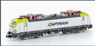
H2978 E-LOK BR 193 VECTRON CAPTRAIN, EP.VI H2978S MIT SOUND