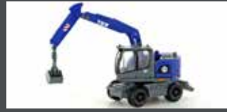
LC4261 LIEBHERR COMPACT BAGGER THW M. GREIFER