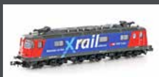
K10176 E-LOK RE 620 SBB CARGO / XRAIL, EP.V-VI, MIT KLIMAAANLAGE