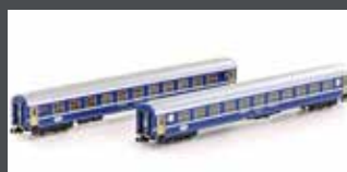
K23009 2ER SET RIC LIEGEWAGEN BCM SBB, EP.IV