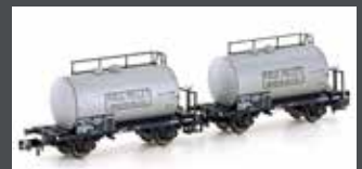
H24852 2ER SET LEICHTBAU-KESSELWAGEN SNCF/MILLET, EP.III