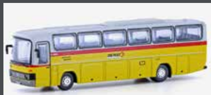
LC4428 MERCEDES BENZ 0303 RHD PTT (CH)