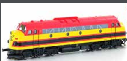
HE10044564 NOHAB MY 1151 EIVEL "KANSAS CITY" EP.VI GELB/ROT, AC SOUND