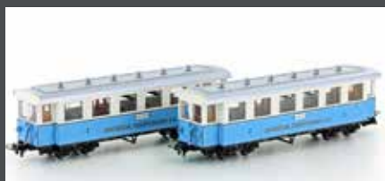
H43101 ZUGSPITZBAHN 2 WAGEN H0M / 12MM