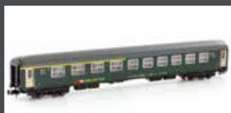
K23121 SBB RIC WAGEN NEUES LOGO 1/2. KL. ABM