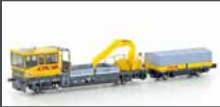
H23565 GLEISKRAFTWAGEN ROBEL SERIE 700 CFL, EP.V-VI, MOTORISIERT