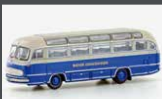
LC4435 MERCEDES BENZ 0321H WIENER LOKALBAHNEN