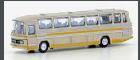
LC4416 MERCEDES BENZ 0302 RÜH CREME/ORANGE