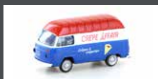
LC3952 VW T2 FOODTRUCK "CRÊPES"