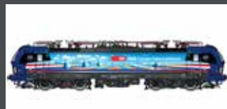
LS17113 E-LOK BR 193 525 SBB CARGO / HOLLANDPIERCER, EP.VI LS17113S MIT SOUND LS17613 AC