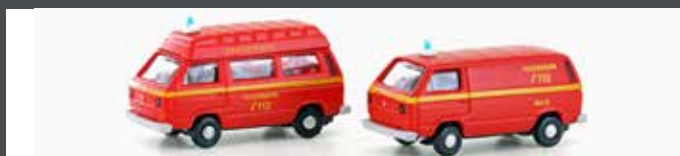
LC4342 VW T3 2ER SET FEUERWEHR