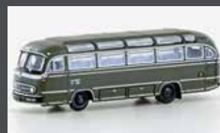
LC4438 MERCEDES BENZ 0321H US ARMY BERLIN, GRÜN