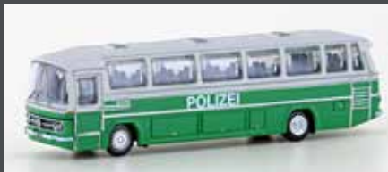
LC4414 MERCEDES BENZ 0302 RÜH POLIZEI