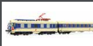
JC74410 TRIEBZUG RH 4010.29, 6-TLG. ÖBB, EP.IV, PFLATSCH