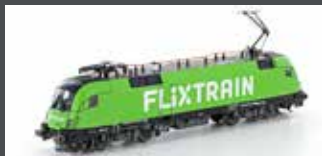
JC18182 E-LOK BR182.505 TAURUS FLIXTRAIN, EP.VI, AC SOUND