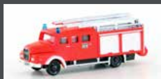
LC4221 MAN LF 16-TS FEUERWEHR, LEUCHTROT