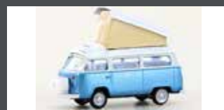
LC3929 VW T2 CAMPER TÜRKIS/ WEISS (METALLIC SERIE)