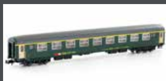
K23120 SBB RIC WAGEN NEUES LOGO 1. KL. AM