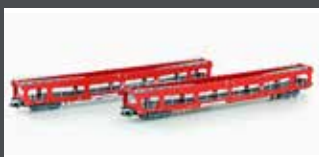
MF33309 2ER SET AUTOTRANSPORTWAGEN DDM 916 DB AUTOZUG, EP.VI, ROT