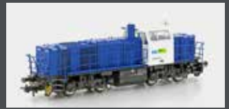
90256 DIESELLOK VOSSLÖH G1000 BLS, EP.VI DC