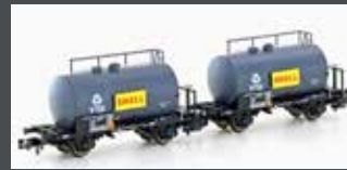
H24831 2ER SET LEICHTBAU-KESSELWAGEN DB/VTG/SHELL, EP.IV