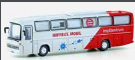
LC4427 MERCEDES BENZ 0303 RHD IMPFBUS