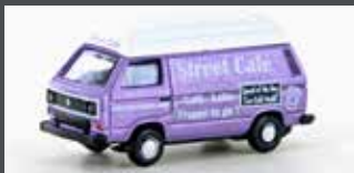
LC4346 VW T3 STREET CAFÉ (METALLIC SERIE)