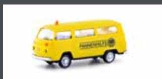
LC3925 VW T2 BUS ÖAMTC PANNENHILFE