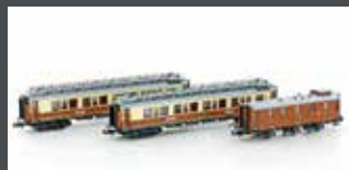
H22102 3-TLG. CIWL SET 1 SIMPLON-EXPRESS EP.I