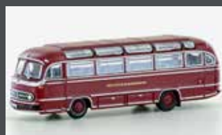
LC4437 MERCEDES BENZ 0321H DB BAHNBUS