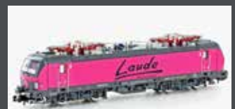
H30157 E-LOK BR 193 VEC-TRON LAUDE, EP.VI H30157S MIT SOUND