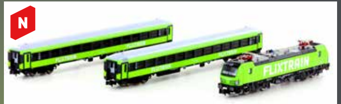
LC95005 FLIXTRAIN SET 5 3-TLG. BR 193 + 2X BMMZ, NEUES DESIGN