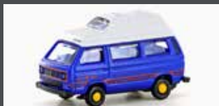
LC4350 VW T3 WESTFALIA CAMPER (METALLIC SERIE)