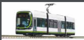
K148041 STRASSENBAHN HIRODEN 1000 LRV HER, EP.VI