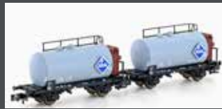
H24802 2ER SET LEICHTBAU-KESSELWAGEN DB/ARAL, EP.III