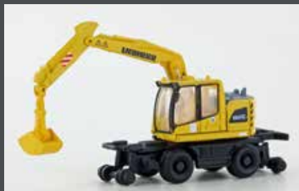
LC4265 LIEBHERR A922 RAIL 2-WEGE BAGGER MIT GREIFER