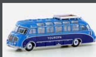
LC4455 SETRA S8 TOUROPA