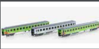
LC95004 3ER SET PERSONENWAGEN BIMZ 264, FLIXTRAIN