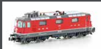
H3028 E-LOK RE 4/4 II 11140 SBB, EP.VI, EINHOLMSTROM-ABNEHMER