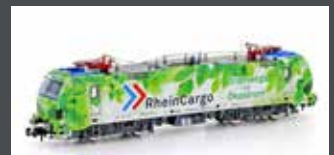
H30150 E-LOK BR 192 SMARTRON RHEINCARGO, EP.VI H30150S MIT SOUND