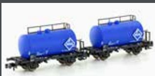
H24833 2ER SET LEICHTBAU-KESSELWAGEN DB/ARAL, EP.IV