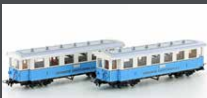
H43103 ZUGSPITZBAHN 2 WAGEN H0E / 9MM