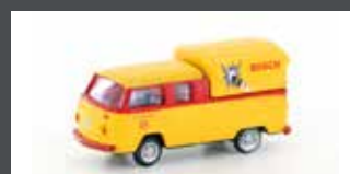
LC3953 VW T2 DOKA "BOSCH"