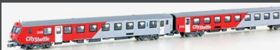
NEM 651 VI

JC60370 3-TLG. SET WENDEZUG-SET * STEUERWAGEN MIT LICHTWECHSEL * 6PIN SCHNITTSTELLE * 2X 2. KLASSEWAGEN * SPARLACK-LACKIERUNG