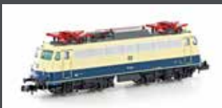
H28012 E-LOK BR 110.3 DB EP. IV, OZEANBLAU / BEIGE