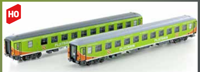
LS46014 2ER SET LIEGEWAGEN BVCMZ 248.5 FLIXTRAIN, EP.VI, HH-KÖLN