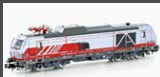
H3122 ZWEIKRAFTLOK BR 248 VECTRON DM MKB, EP.VI H3122S MIT SOUND