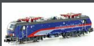
H30162 E-LOK RH 1293 200 VECTRON ÖBB NIGHTJET, EP.VI