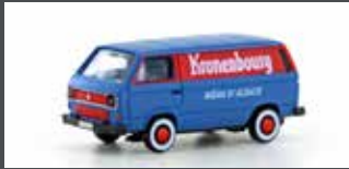
LC4327 VW T3 KASTEN KRONENBOURG