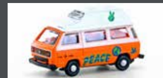
LC4351 VW T3 WESTFALIA CAMPER "GRAFFITI"