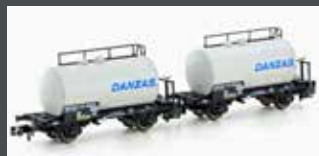
H24834 2ER SET LEICHTBAU-KESSELWAGEN DB/DANZAS, EP.IV