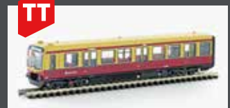
LC90484 SOUVENIR BR481 S-BAHN BERLIN 1:120 3.BETR.NR