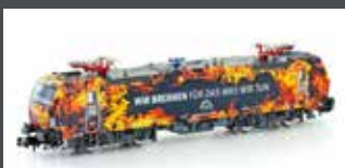
H30151 E-LOK BR 1923 878 VEC-TRON TXL "WIR BRENNEN", EP.VI H30151S MIT SOUND