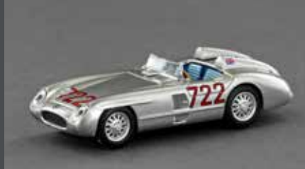
LE87302 MB 300 SLR ROADSTER #722, 2 KOPFSTÜTZEN. FAHRER: STIRLING MOSS UND DENIS JENKINSON, SIEGER MILLE MIGLIA 1956, 1:87