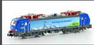
H2998 E-LOK BR 193 VECTRON HUPAC BLS, EP.VI H2998S MIT SOUND