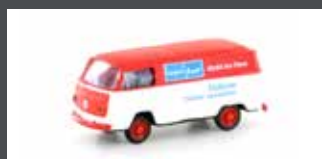
LC3917 VW T2 TRANSPORTER "BOFRÖST"