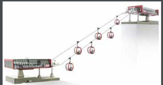
JC82498 D-LINE SET KOHLMAISBAHN, 1 X TALSTATION MIT BELEUCHTUNG UND ANTRIEB 1 X BERGSTATION MIT BELEUCHTUNG 6 X OMEGA V10 „KOHLMAISBAHN“ 1 X STRECKENKABEL 3 M 1 X SEIL 10 M