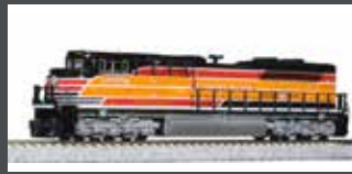
K1768406 DIESELLOK EMD SD70ACE UP/SP HERITAGE EP.6