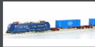
LC96004 GÜTERZUG E-LOK BR 192 + 2x CONTAINERWAGEN EVB LC96004S MIT SOUND