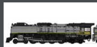
K1260403 DAMPFLOK FEF-3 UNION PACIFIC EP.2/6, GREY-HOUND