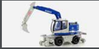
LC4259 LIEBHERR A922 RAIL 2-WEGE BAGGER KIBAG (CH) M. TIEFLÖFFEL