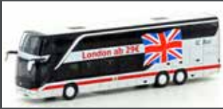
LC4462 SETRA S 431 DT DB IC BUS / LONDON