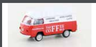
LC3950 VW T2 FOODTRUCK "COFFEE"