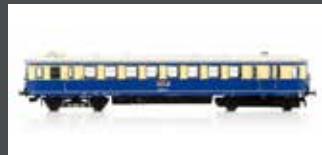
JC13020 TRIEBWAGEN RH 5044.21 ÖBB, EP.IV, CREME/BLAU, AC JC13022 AC SOUND