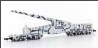
H23603 LEOPOLD EISENBahn-GESCHÜTZ K5, EPOCHE II, IN WINTER-TARNLACKIERUNG