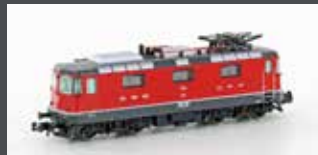
H3021 E-LOK RE 4/4 II 1.SERIE SBB, ROT, EP. III-IV