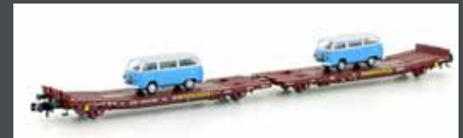
H23782 FLACHWAGEN TWA 800A LADKS TRANSWAGGON, MIT 2X VW T2, EP.VI