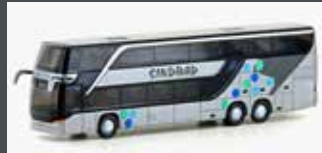
LC4486 SETRA S 431 DT SINDBAD (PL), METALLIC