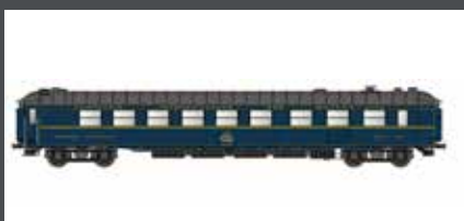
LS49198 SPEISEWAGEN WR52 CIWL, EP.IV, 1971, ITALIENISCH