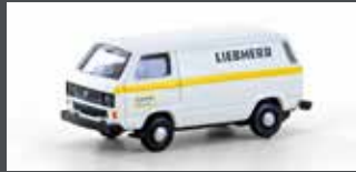
LC4341 VW T3 LIEBHERR SERVICE