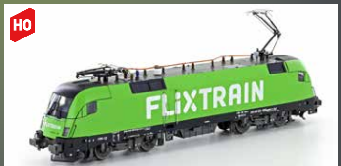
JC18182 E-LOK BR182.505 TAURUS FLIXTRAIN, EP.VI, AC SOUND JC28180 DC JC28182 DC SOUND