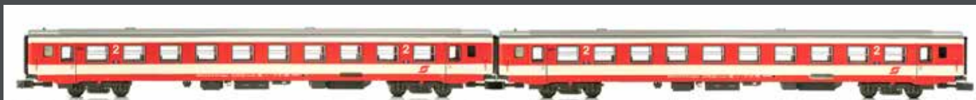
NEM IV JC60270 2-TLG. SEIT REISEZUGWAGEN SPARLACK-LACKIERUNG