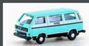
LC4348 VW T3 BUS DEUTSCHE TOURING