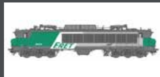
LS10332 E-LOK CC 6553 FRET SNCF EP. V-VI