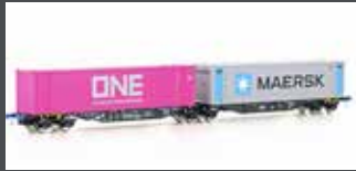
90661 CONTAINERWAGEN SGGMRSS'90 PKP CARGO, EP.VI, ONE/MAERSK