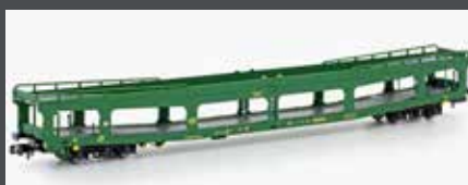
MF33311 AUTOTRANSPORTWAGEN DDM 916 SNCB, EP. IV