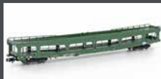
MF33300 AUTOTRANSPORTWAGEN DDM 916 DR, EP.IV