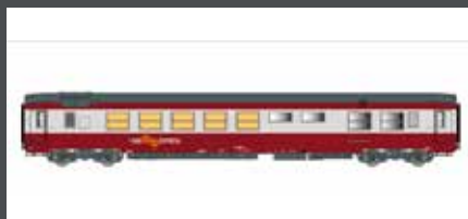
LS40154 SPEISEWAGEN "GRIL EXPRESS" SNCF, EP.IV, ROT/GRAU