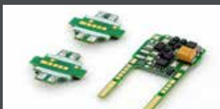
K10950-D1 DECODER FÜR GRUNDSET ICE 4