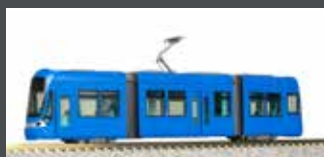
K14805-1 MODERNER STRASSENBAHN-GELENKTRIEBWAGEN, EP.V-VI, BLAU