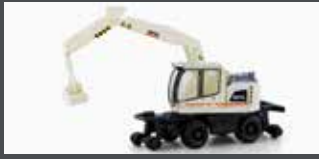
LC4253 LIEBHERR A922 RAIL 2-WEGE BAGGER SERSA MIT GREIFER