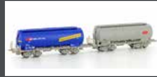
H23483 2TLG. SILOWAGEN UACS SBB BLAU / GRAU EP.VI