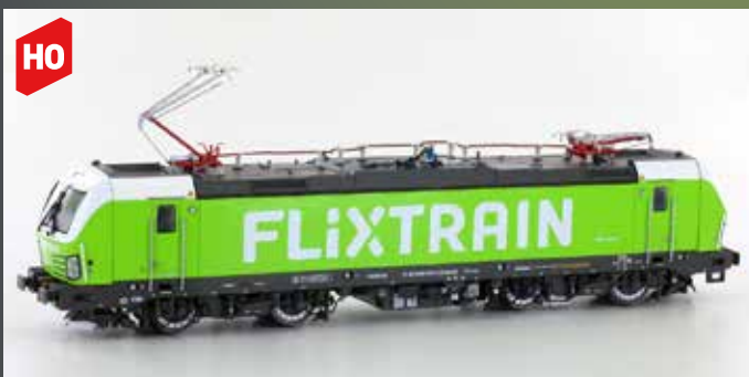
LS16074 E-LOK BR193 VECTRON FLIXTRAIN D-RPOOL EP.VI LS16574 SOUND