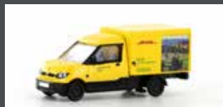
LC4554 STREETSCOOTER WORK "DHL STUTT GART" 1:160