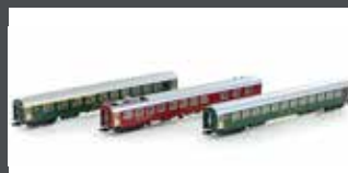
K23013 3ER SET RIC PERSONENWAGEN ABM+BM+WRTM SBB, EP. IV-V