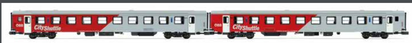
NEM IV JC60280 2ER SET REISEZUGWAGEN ÖBB EP. VI CITY SHUTTLE