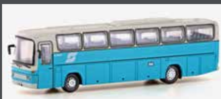
LC4424 MERCEDES BENZ 0303 RHD ÖBB BAHNBUS (AT)