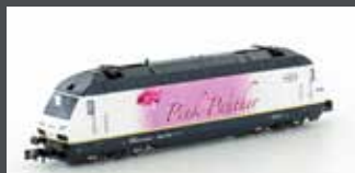
K137122 E-LOK BLS RE465 PINK PANTHER EP.IV-V