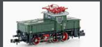
H3051 E-LOK E63 DB, EP.III, GRÜN/SCHWARZ/ROT