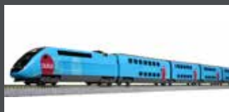
K101763 TRIEBZUG TGV DUPLEX, 10-TLG. SNCF/OUIGO, EP.VI