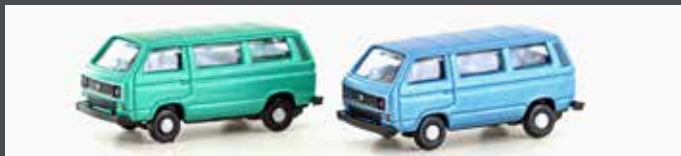
LC4347 VW T3 2ER SET (METALLIC SERIE)