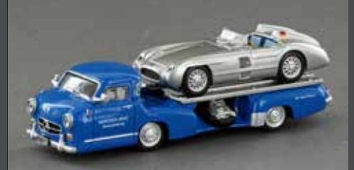
LE87310 MERCEDES BENZ RENNTRANSPOR- TER, „DAS BLAUE WUNDER“ BELADEN MIT EINEM MERCEDES BENZ 300 SLR ROADSTER, 1:87