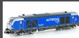
H3112 DIESELLOK BR 247 908 AUTOZUG SYLT, EP.VI H3112S MIT SOUND