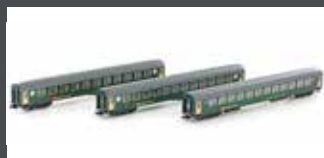
K23012 3ER SET RIC PERSONENWAGEN BM, 2.KL. SBB, EP. IV-V