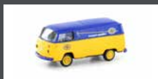
LC3918 VW T2 TRANSPORTER ASG