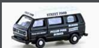
LC4349 VW T3 STREET FOOD