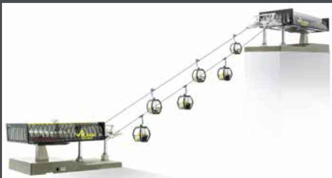
JC82499 D-LINE SET PLANAI, 1 X TALSTATION MIT BELEUCHTUNG UND ANTRIEB 1 X BERGSTATION MIT BELEUCHTUNG 6 X OMEGA V10 „PLANAI“ (5 X SCHWARZ, 1 X GELB) 1 X STRECKENKABEL 3 M 1 X SEIL 10 M