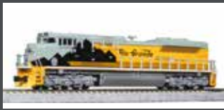
K1768405 DIESELLOK EMD SD70ACE UP/D&RGW HERITAGE EP.6