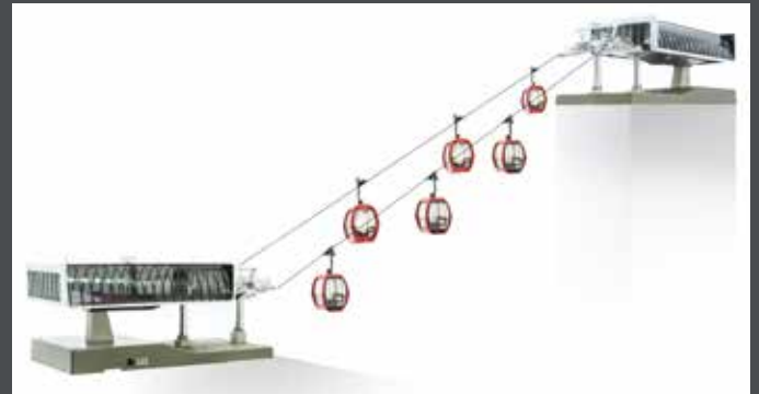
JC82497 D-LINE SET WEISS/GRAU, 1 X TALSTATION MIT BELEUCHTUNG UND ANTRIEB 1 X BERGSTATION MIT BELEUCHTUNG 6 X OMEGA V10 „ROT“ 1 X STRECKENKABEL 3 M 1 X SEIL 10 M