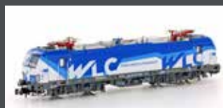
H30155 E-LOK RH 1193 VEC-TRON WLC, EP.VI H30155S MIT SOUND