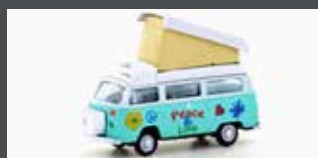
LC3928 VW T2 CAMPER "PEACE AND LOVE"