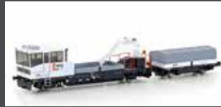
H23566 GLEISKRAFTWAGEN ROBEL TM234 SERSA, EP. VI, MOTORISIERT