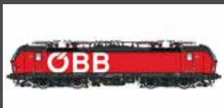
LS17911 E-LOK RH 1293 VECTRON ÖBB, EP.VI, AC LS17911S MIT SOUND