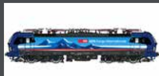
LS17111 E-LOK BR 193 SBB CARGO ALPPIERCER 2, D/A/CH/NL, EP.VI LS17111S MIT SOUND