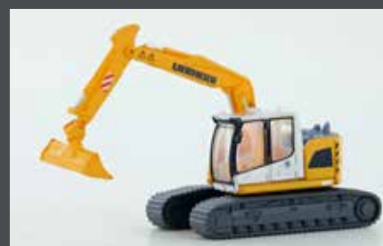
LC4267 LIEBHERR COMPACT KETTEN-BAGGER MIT BÖSCHUNGSSCHAUFEL