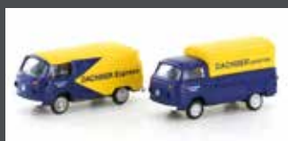
LC3921 VW T2 SET "DACHSER SPEDITION"