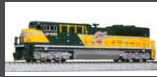
K1768407 DIESELLOK EMD SD70ACE UP/CNW HERITAGE EP.6