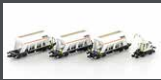
LC66306 3ER SET SCHÜTTGUTWAGEN + LIEBHERR A922