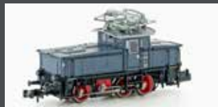
H3050 E-LOK E63 DRG, EP.II, GRAU/BLAU