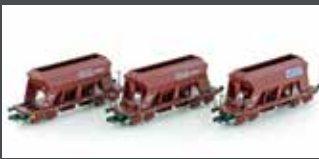
LC66305 3ER SET SCHÜTTGUTWAGEN RAG, EP.IV-V