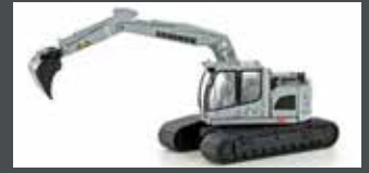
LC4264 LIEBHERR COMPACT BAGGER KETTE SILBER M. TIEFLÖFFEL