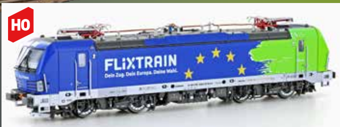
LS16078 E-LOK BR193 VECTRON FLIXTRAIN D-RPOOL EP.VI