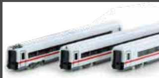
K10953 ERGÄNZUNG BR 412 / ICE4, 3-TLG. DB AG / KLIMASCHÜTZER