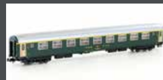
K23119 SBB RIC WAGEN ALTES LOGO 1. KL. AM