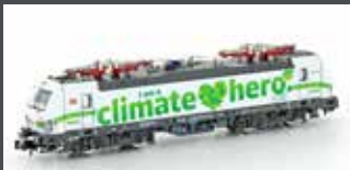
H3013 E-LOK BR 193 363 VECTRON DB "CLIMATE HERO", EP.VI H3013S MIT SOUND