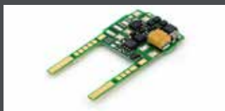
K10950-D2 FAHRDECODER FÜR ERGÄNZUNG ICE 4