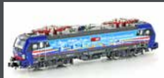
H3014 E-LOK BR 193 VECTRON SBB CARGO NL-PIERCER, EP.VI