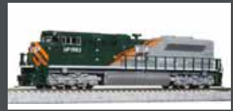
K1768410 DIESELLOK EMD SD70ACE UP/WP HERITAGE EP.6