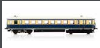
JC13010 TRIEBWAGEN RH 5044.06 ÖBB, EP.III/IV, CREME/BLAU, AC JC13012 AC SOUND