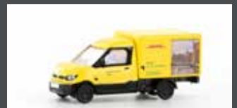
LC4555 STREETSCOOTER WORK "DHL HAMBURG" 1:160