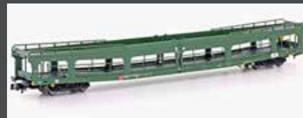
MF33305 2ER SET AUTOTRANSPORTWAGEN DDM 916 ZSSK, EP.V- VI