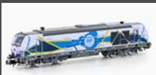
H3115 DIESELLOK BR 247 EGP, EP.VI H3115S MIT SOUND