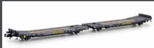
H23781 DOPPELFLACHWAGEN TWA 800A LAADKS TRANSWAGGON DR, EP.IV