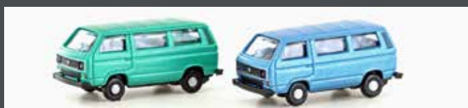
LC4347 VW T3 2ER SET (METALLIC SERIE)