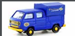
LC4357 VW T3 DOKA ASG