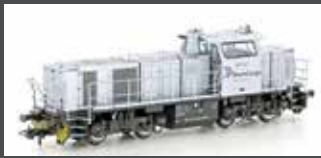
90236 DIESELLOK VOSSLÖH G1000 BB RHEINCARGO, EP.VI