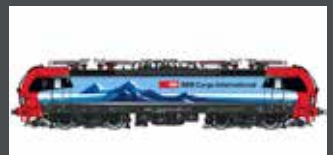
LS17114 E-LOK BR 193 461 SBB CARGO / ALPPIERCER 1, EP.VI LS17114S MIT SOUND