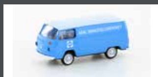
LC3922 VW T2 DOKA "ARAL TANKSTELLENDIENST"