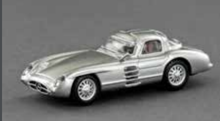
LE87300 MB 300 SLR UHLENHAUT COUPÉ, W 196 S, SILBER MIT ROTER INNENAUS- STATTUNG, 1:87