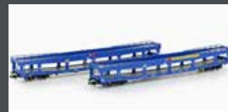
MF33301 2ER SET AUTOTRANSPORTWAGEN DDM 916 EETC, EP.VI, BLAU