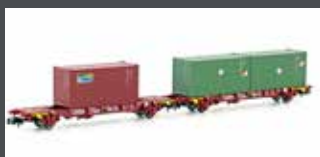
MF33373 2ER SET CONTAINERWAGEN LGS SNCB, EP.V