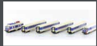
JC74110 TRIEBZUG RH 4010.14, 6-TLG. ÖBB, EP.IV, PFLATSCH