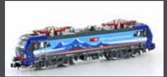
H3007 E-LOK BR 193 VECTRON SBB CARGO ALPPIERCER 2 D/A/CH/NL, EP.VI H3007S MIT SOUND