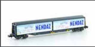
H23462 SBB HABILS "NENDAZ WASSER" GÜTERWAGEN, EP.V