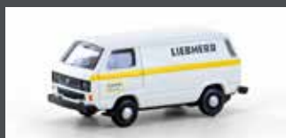
LC4341 VW T3 LIEBHERR SERVICE