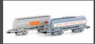
H23491 2ER SET SILOWAGEN UACS SBB GRANOL + COOP, EP.IV