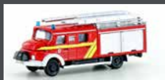
LC4204 MB LF 16 TS FEUER- WEHR LOTTE / OSNABRÜCK