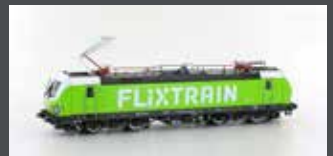
LS16074 E-LOK BR193 VECTRON FLIXTRAIN D-POOL EP.VI