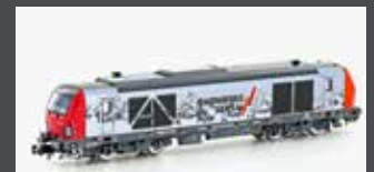
H3114 DIESELLOK BR 247 VECTRON DE SERSA, EP.VI H3114S MIT SOUND