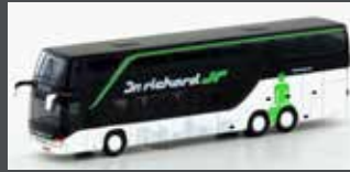
LC4481 SETRA S 431 DT DR. RICHARD (AT)