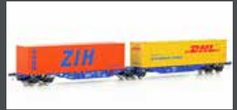
90663 CONTAINERWAGEN SGGMRSS'90 CBR, EP.VI, DHL/ZIH