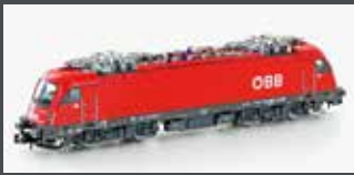
H2734 E-LOK RH 1216 TAURUS ÖBB, EP.VI H2734S MIT SOUND