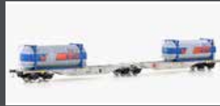
90662 CONTAINERWAGEN SGGMRSS'90 ÖBB, EP.VI, TROLL