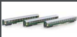
K23011 3ER SET RIC PERSONENWAGEN BM, 2.KL. SBB, EP.IV