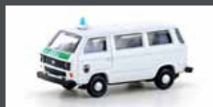
LC4352 VW T3 BUS ZOLL