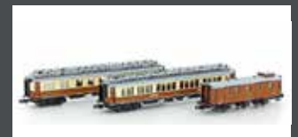
H22103 3-TLG. CIWL SET 2 SIMPLON-EXPRESS EP.I