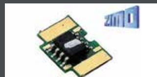
K10950-D3 FUNKTIONSDECODER FÜR INNENBELEUCHTUNG