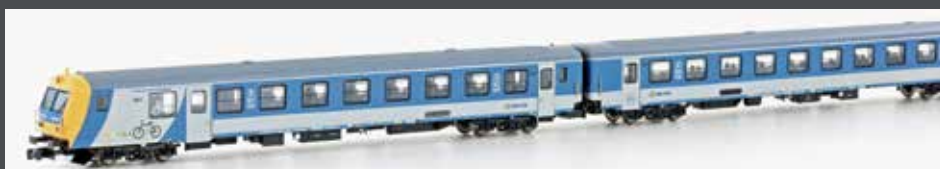
NEM 651 VI

JC60360 3-TLG. SET WENDEZUG-SET EP IV * STEUERWAGEN MIT LICHTWECHSEL * 6PIN SCHNITTSTELLE * 2X 2.KLASSEWAGEN * MAV-LACKIERUNG