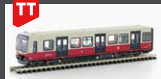
LC90483 SOUVENIR BERLINER S-BAHN BR 481 DESIGN 2020 1:120 EXKL. LEMKE