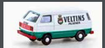
LC4358 VW T3 VELTINS