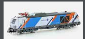
H3124 ZWEIKRAFTLOK BR 248 VECTRON DM NORTHRAIL, EP.VI H3124S MIT SOUND