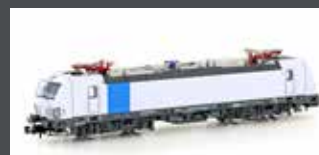
H30156 E-LOK BR 193 813 VEC-TRON RAILPOOL, EP.VI