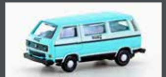
LC4348 VW T3 BUS DEUTSCHE TOURING