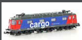
K10175 E-LOK RE 620 SBB CARGO, EP.V-VI, MIT KLIMAAANLAGE