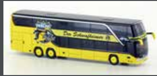
LC4477 SETRA S 431 DT KEV MANNSCHAFTSBUS