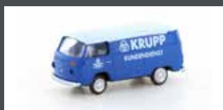
LC3897 VW T2 TRANSPORTER KRUPP KUNDENDIENST