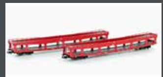
MF33303 2ER SET AUTOTRANSPORTWAGEN DDM 916 EETC, EP.VI, ROT