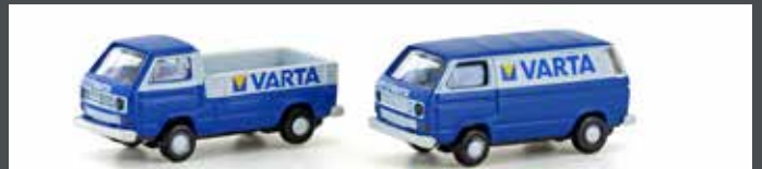
LC4345 VW T3 2ER SET VARTA