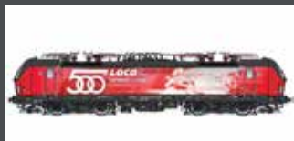
LS17912 E-LOK RH 1293 018 VECTRON ÖBB, EP.VI, 500TH, AC LS17912S MIT SOUND