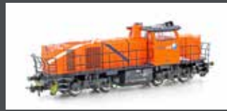
90248 DIESELLOK VOSSLÖH G1000 BB NORTHRAIL, EP.VI