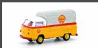
LC3954 VW T2 PRITSCHÉ SHELL