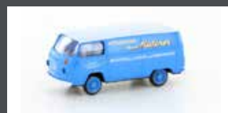
LC3920 VW T2 TRANSPORTER "MATZNER FEINKOST"