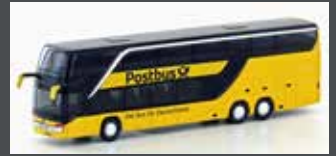
LC4482 SETRA S 431DT POST- BUS