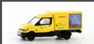
LC4553 STREETSCOOTER WORK "DHL RUHRGEBIET" 1:160