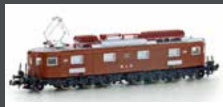
H10184 E-LOK AE 6/8 BLS 8-ACHSIG 207 BRAUN, EP.III