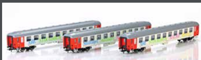
HE13060803 LIEGEWAGEN SET 3TLG. 2.KLASSE "BERLIN NIGHT EXPRESS" DC