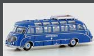
LC4456 SETRA S8 AUSTROBUS (AT)