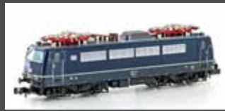
H2884 E-LOK BR 184 111-3 DB, EP.IV, STAHLBLAU