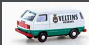
LC4358 VW T3 VELTINS