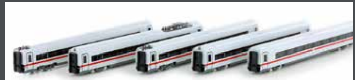
K10954 ERGÄNZUNG BR 412 / ICE4, 5-TLG. DB AG / KLIMASCHÜTZER, MOTORISIERT K10954S MIT SOUND