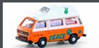
LC4351 VW T3 WESTFALIA CAMPER "GRAFFITI"