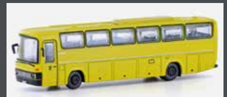
LC4429 MERCEDES BENZ 0303 RHD DEUTSCHE BUNDESPOST