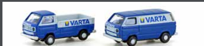
LC4345 VW T3 2ER SET VARTA