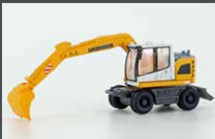
LC4266 LIEBHERR COMPACT BAGGER MIT TIEFLÖFFEL