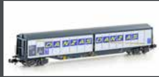
H23473 SCHIEBEWANDWAGEN HABILS SBB / DANZAS, EP.IV.V