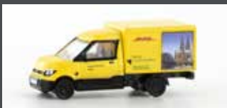
LC4552 STREETSCOOTER WORK "DHL KÖLN" 1:160