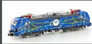
H3006 E-LOK BR 192 SMARTRON EGP, EP.VI H3006S MIT SOUND