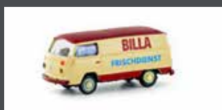
LC3945 VW T2 TRANSPORTER BILLA