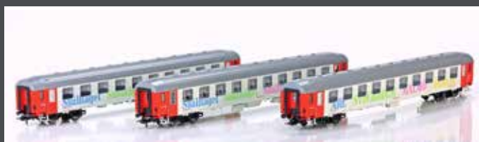
HE13060801 LIEGEWAGEN SET 3TLG. 2.KLASSE "BERLIN NIGHT EXPRESS" DC