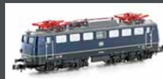
H28121 E-LOK BR 110.1 DB, EP.IV, BLAU / SCHWARZ H281125 MIT SOUND