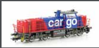
90240 DIESELLOK VOSSLÖH AM 842 SBB CARGO, EP.VI