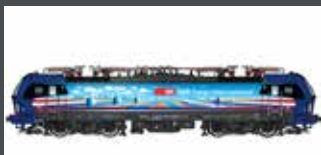
LS17112 E-LOK BR 193 518 SBB CARGO / CENERI, EP.VI LS17112S MIT SOUND