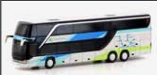
LC4485 SETRA S 431 DT WESTBUS (AT)