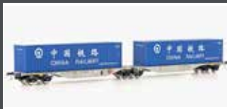
90702 CONTAINERWAGEN SGGMRSS'90 AAE, EP.VI, CHINA RAIL