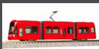
K14805-2 MODERNER STRASSENBAHN-GELENKTRIEBWAGEN, EP.V-VI, ROT