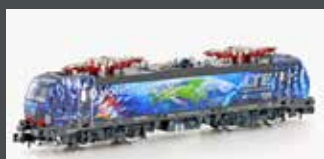
H30161 E-LOK BR 193 VECTRON LTE, EP.VII H30161S MIT SOUND