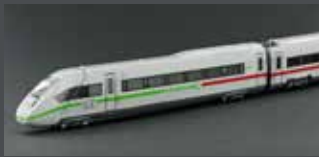
K10952 BR 412 / ICE4, 4-TLG. DB AG / KLIMASCHÜTZER, GRUNDSETMOTORISIERT K10952S MIT SOUND