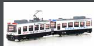
K14503-3 KATO POCKET LINE STRASSENBAHN 2TLG. PATROL TRAM