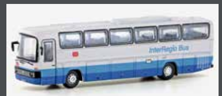
LC4426 MERCEDES BENZ 0303 RHD DB INTERREGIO BUS