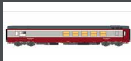
LS40158 SPEISEWAGEN VRU "GRIL EXPRESS" SNCF, EP.IV, PROTOTYP, ROT/GR