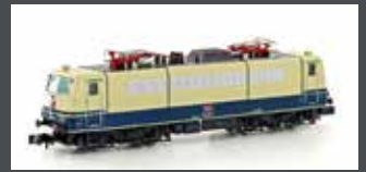
H2885 E-LOK BR 184 003-2 DB MUSEUMLOK, EP.V, BLAU/BEIGE H2885S MIT SOUND