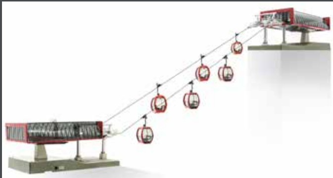
JC82496 D-LINE SET ROT/SCHWARZ, 1 X TALSTATION MIT BELEUCHTUNG UND ANTRIEB 1 X BERGSTATION MIT BELEUCHTUNG 6 X OMEGA V10 „ROT“ 1 X STRECKENKABEL 3 M 1 X SEIL 10 M