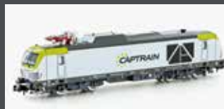
H3123 ZWEIKRAFTLOK BR 248 VECTRON DM CAPTRAIN, EP.VI H3123S MIT SOUND