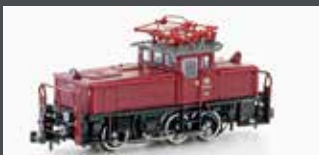
H3052 E-LOK BR 163 DB, EP.IV, ROT/SCHWARZ