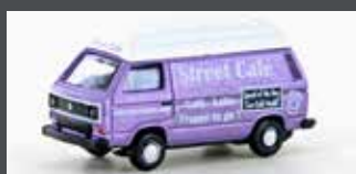
LC4346 VW T3 STREET CAFÉ (METALLIC SERIE)