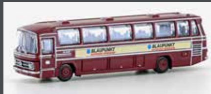
LC4415 MERCEDES BENZ 0302 RÜH DB BAHNBUS