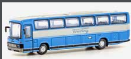
LC4425 MERCEDES BENZ 0303 RHD DEUTSCHE TOURING