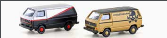
LC4344 VW T3 2ER SET TUNING (METALLIC SERIE)