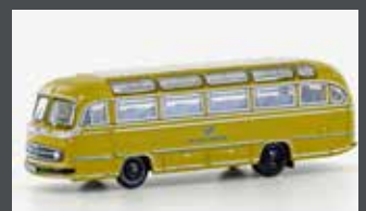
LC4439 MERCEDES BENZ 0321H DEUTSCHE BUNDESPOST