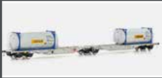
90660 CONTAINERWAGEN SGGMRSS'90 HUPAC, EP.VI, BERTSCHI