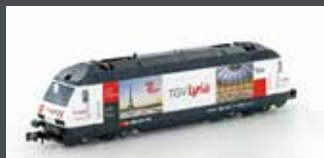
K137120 E-LOK SBB RE4/4 460 TGV LYRIA, EP. IV-V