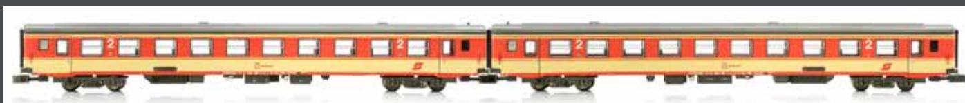
NEM IV JC60260 2-TLG. SET REISEZUGWAGEN JAFFA- LACKIERUNG