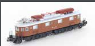
H10183 E-LOK AE 6/8 BLS 8-ACHSIG 203 BRAUN, KURZES FH, EP.IV