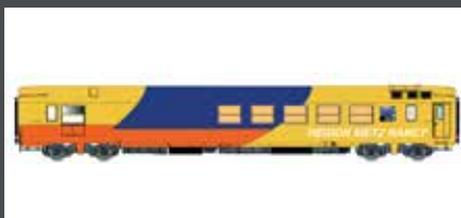
LS40155.1 MESSWAGEN SR SNCF, EP.V, BLAU/GELB/ORANGE, METZ/NANCY