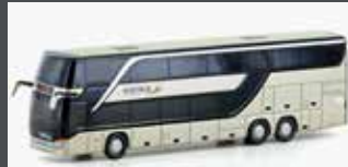
LC4487 SETRA S 431 DT POSTBUS (AT), METALLIC GOLD