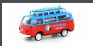
LC3923 VW T2 BUS "SURFING"