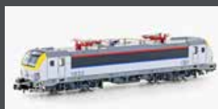
H30163 E-LOK HLE 18 SNCB, EP.VI