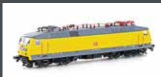
LS16086 BR120 DB EP.V DBAG LOGO GELB/GRAU