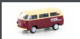
LC3926 VW T2 BUS "TEE"