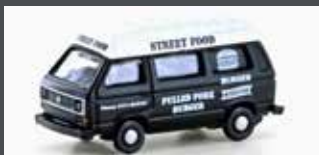
LC4349 VW T3 STREET FOOD