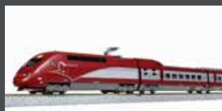
K101658 TRIEBZUG TGV T HALYS PBKA, 10-TLG., EP.VI, NEUES DESIGN