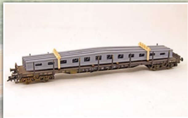
H01351 Spannbetonträger Länge: 195 mm