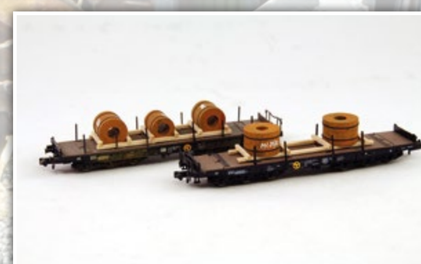
N1105 Blechcoil Set, 2-teilig Länge: 2 x 60 mm