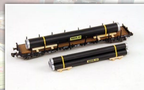
N1106 Stahlbauröhren, 2-teilig Länge: 100 und 80 mm