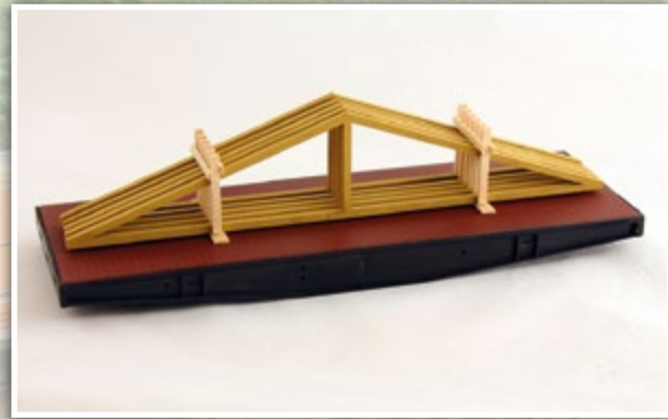
01066 Dachbinder Länge: 200 x 40 mm