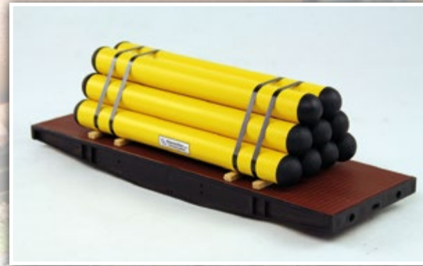
01067 Gasröhren mit Stopfen Länge: 160 x 65 mm