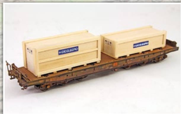
H01356 Transportkistenset, 2-teilig Länge: 2 x 70 mm