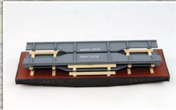
01068 Brückenwangen Länge: 190 x 65 mm