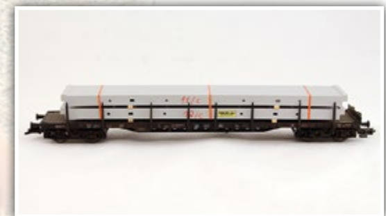
H01358 Betonfertigteile Länge: 195 mm