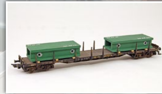
H01350 Pressenteile Länge: 2 x 70 mm