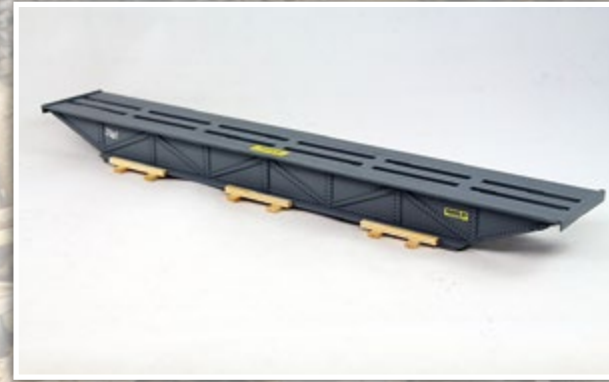
01069 Stahlbrückenrohbau Länge: 320 x 60 mm