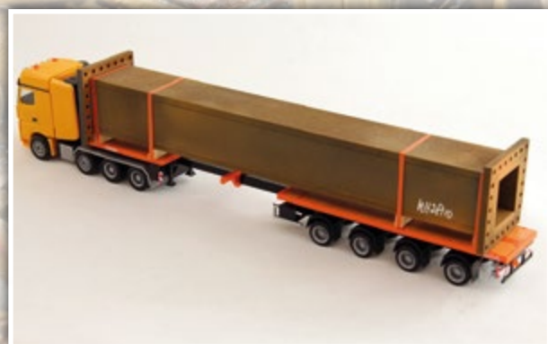
LKW1065 Große alte Stahlstütze Länge: 200 x 35 mm