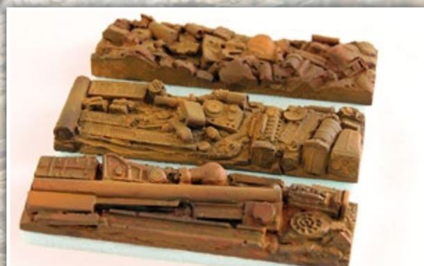
H01357 Schrotteinsätze für E-Wagen, 3-teilig Länge: 3 x 99 mm