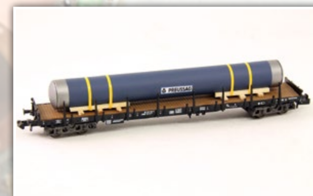
N1110 Druckrohr mit Schutzkappen Länge: 102 mm