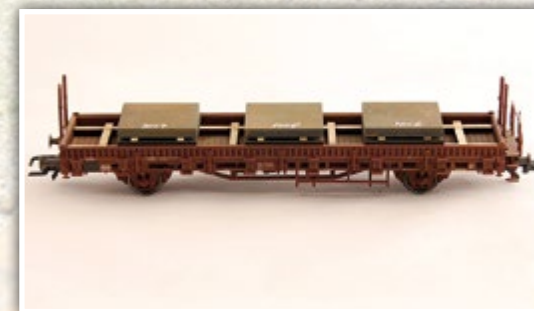
H01348 Blechplattenstapel Länge: 142 mm