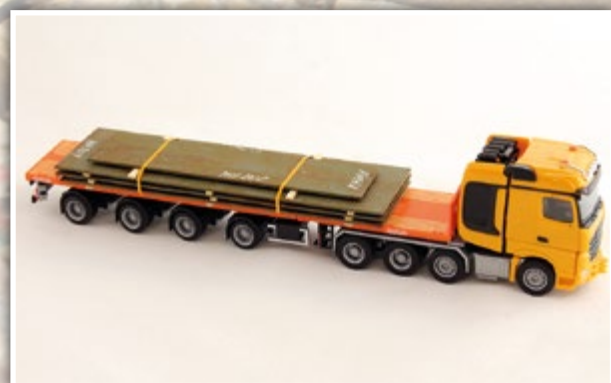
LKW1064 überbreite Bleche Länge: 120 x 34 mm