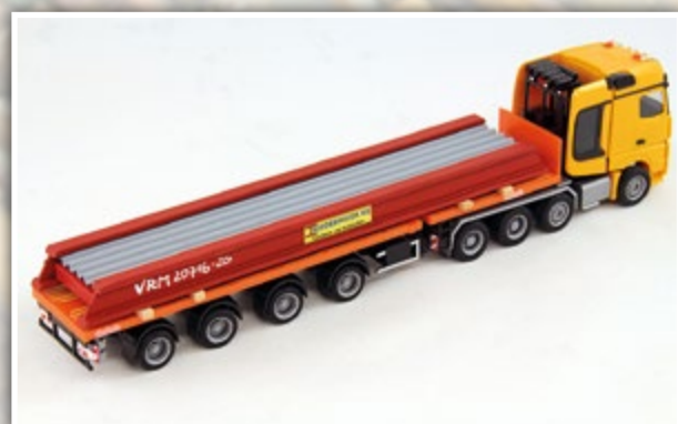
LKW1066 Deckenfertigteil Länge: 150 mm