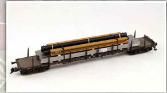
H01354 verschiedene Stahlbauprofile Länge: 120 mm