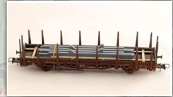
H01352 Betonstützen Länge: 142 mm