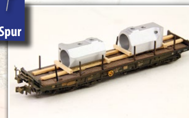
N1108 Guss Formteile Länge: 90 mm