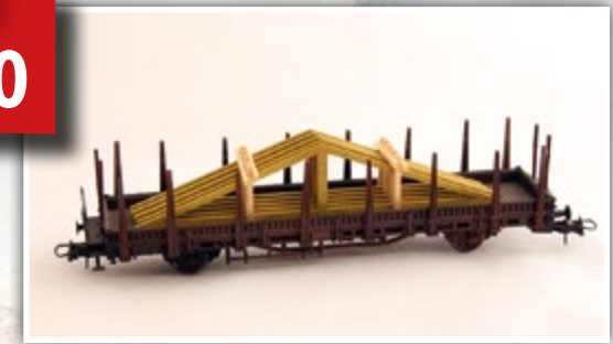
H01349 Dachbinder Länge: 120 mm