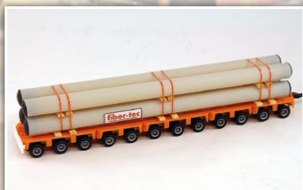
LKW1067 Spezialkunststoffrohre Länge: 205 x 32 mm