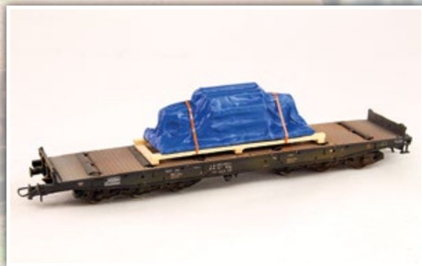
H01359 Industrieteil unter Plane Länge: 88 mm

Verehrter Kunde, wir präsentieren Ihnen auch 2023 wieder viele attraktive Neuheiten in unserem Sortiment. In allen Kategorien finden Sie interessante Neuzugänge und auch etliche Modelländerungen.