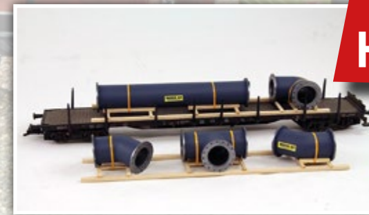
H01355 Druckrohrstücke m. Flanschen, 2-teilig Länge: 2 x 160 mm