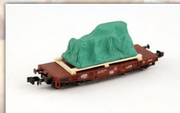
N1109 Maschinenblock unter Plane Länge: 42 mm