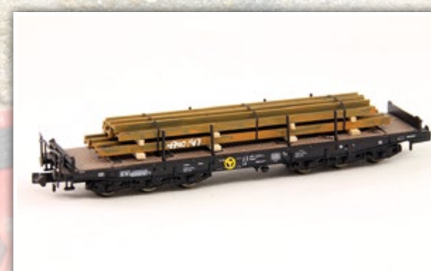
N1107 I-Stahlträger Länge: 80 mm