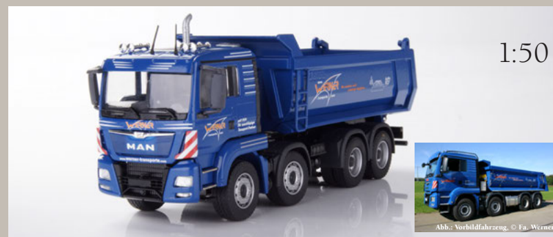
Art.N° 77215/03 MAN TGS L EURO 6 Carnehl Halbschalenmulde 4-achs „Werner“ Carnehl Tipper trough 4-axle “Werner”