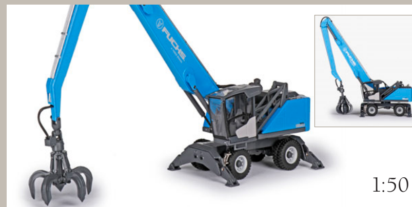
Art.N° 2969/0 FUCHS-TEREX MHL 350 F Lademaschine mit Mehrschalengreifer Loading machine with multiple clamshell