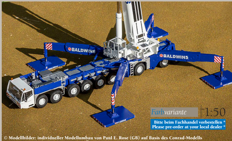
© Modellbilder: individueller Modellumbau von Paul E. Rose (GB) auf Basis des Conrad-Modells