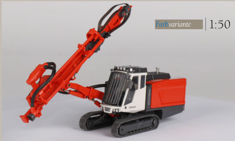
Art.N° 2508/02 SANDVIK PANTERA DP1500 Übertage-Außenlochhammer-Bohrgerät Surface drill rig

Neuheit September/New Item September 2020