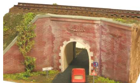
Petit Pont à une arche Dimensions : 210 x 85 x 70mm

Colinter Productions 16 Avenue des Roches F - 55300 Saint Mihiel