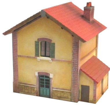
La Maison de Garde-Barrière à un étage type Est – 39,50 Euros Dimensions : 66 x 66mm Hauteur 85mm Appentis : 47 x 18mm Hauteur 34mm