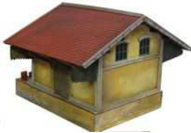
HM1 – Halle Marchandise type Est Toiture à pans asymétriques Longueur 145mm, Largeur 103mm, Hauteur 110mm (avec embase)