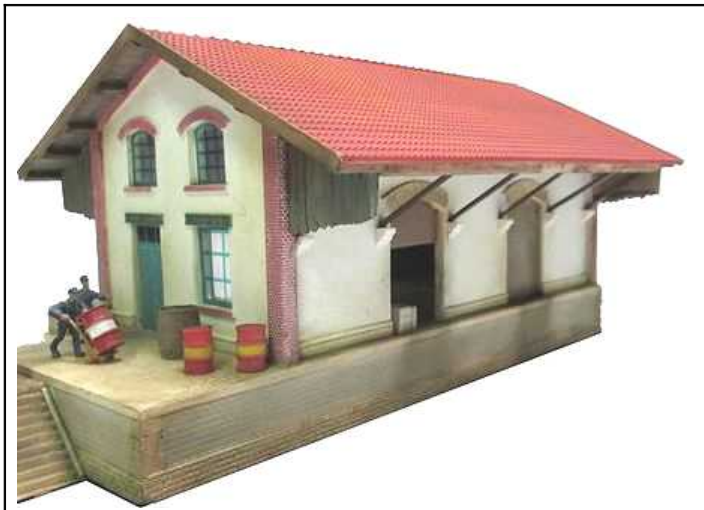
HM7 – Halle Marchandise type Est à 2 portes Toiture à pans symétriques - Longueur 245mm -Largeur base 100mm, Largeur toit 158 - Hauteur 111mm (avec embase)