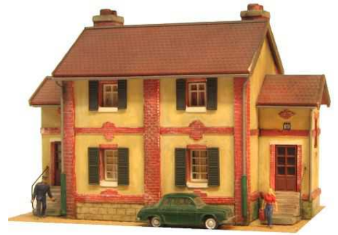
La maison du Cheminot Maison double de cité ouvrière Dimensions 70 x 140 x 195mm