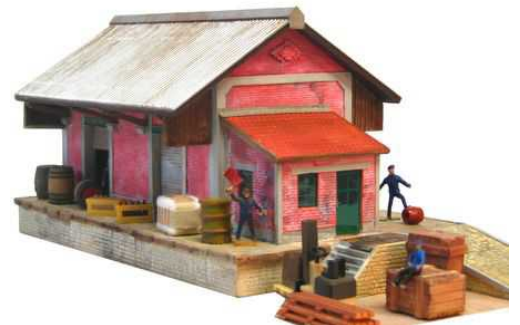
HM5 – Entrepôt à marchandise en briques à deux portes Dimensions : 260 x 110 x hauteur 99mm