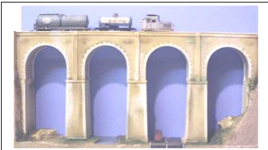
Grand VIADUC en Maçonnerie Dimensions : 565 x 265 x 75mm