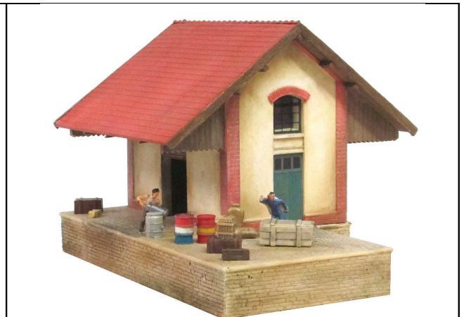
HM6 - La Halle à marchandises d'Eix-Abaucourt Dimensions : 155 x 130mm hauteur : 160mm