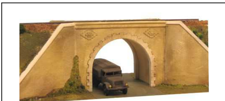
Passage Supérieur Dimensions : 290 (maxi) x 86 x 65mm