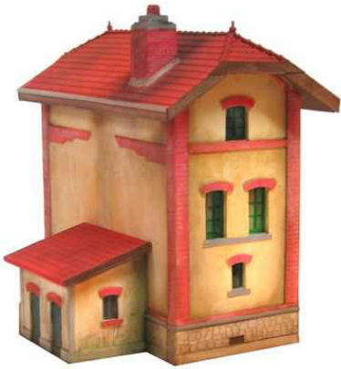
Maison de Garde-Barrière type Est Type reconstruction Dimensions : 140 x 90mm hauteur 135mm