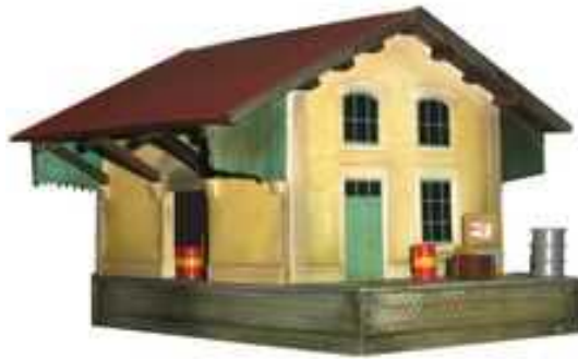
HM2 – Halle Marchandise type Est Toiture à pans symétriques - Longueur 145mm, Largeur 103mm, Hauteur 110mm (avec embase)