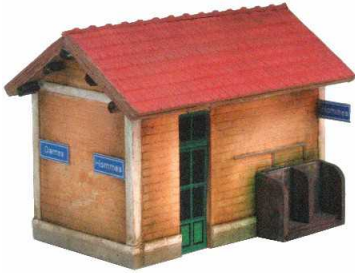
G101 – Lampisterie – WC - type Est Longueur 67mm Largeur 45mm Hauteur 49mm