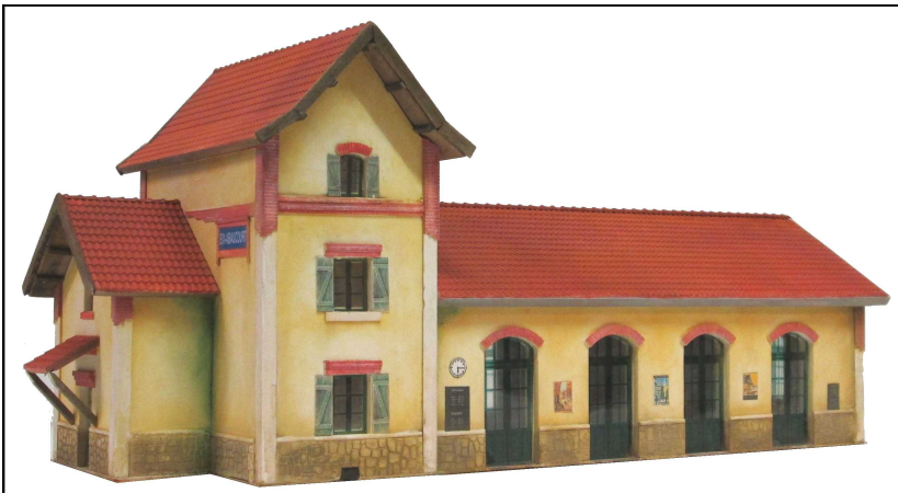
La gare d'Eix-Abaucourt Bâtiment Voyageurs Est type Reconstruction Dimensions : 270 x 120mm hauteur : 135mm