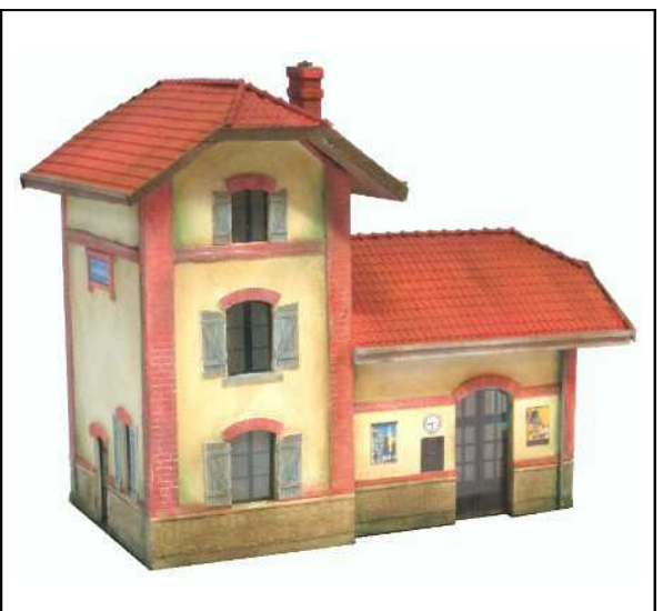
La Halte d'Albestroff - Chauvencourt Petite gare type Est Longueur 150mm Largeur 90mm Hauteur 125mm