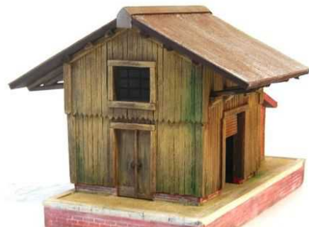
HM-4 – Halle Marchandise – type bois toiture tôle ondulée 135 x 80mm Hauteur 95mm ( avec embase )