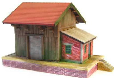
HM-3 – Halle Marchandise - type bois toiture tuile mécaniques 135 x 80mm Hauteur 95mm ( avec embase )