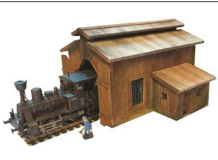
R101 – Remise à Locomotives – type bois Dimensions : 134 x 75mm Hauteur 93mm Porte : 62 x 42mm - Appentis 54 x 32 Hauteur 44mm